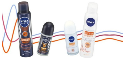
Slika 12: Nivea dezodoransi

Izvor: Nivea obitelj, https://www.beiersdorf.hr/brandovi/nivea , (19.2.2018.)