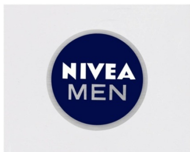
Slika 4: Logo marke Nivea men