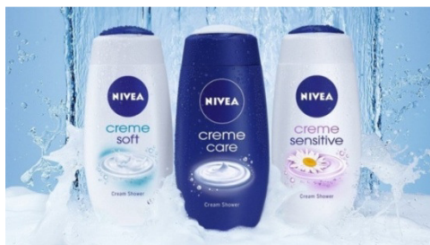
Slika 13: Nivea proizvodi za kupanje