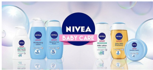
Slika 14: Nivea proizvodi za bebe