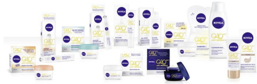
Slika 10: Nivea proizvodi za njegu lica