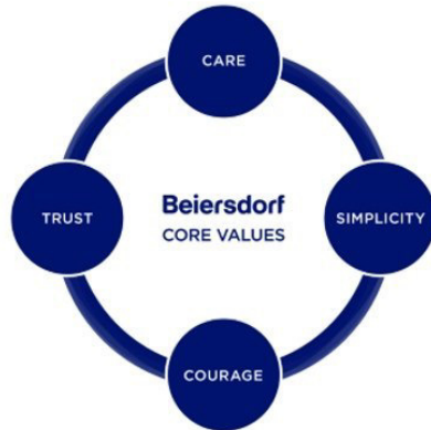
Slika1: Četiri temeljne vrijednosti poduzeća „Beiersdorf“