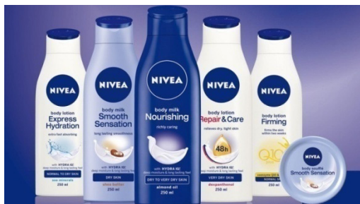
Slika 9: Nivea proizvodi za njegu tijela