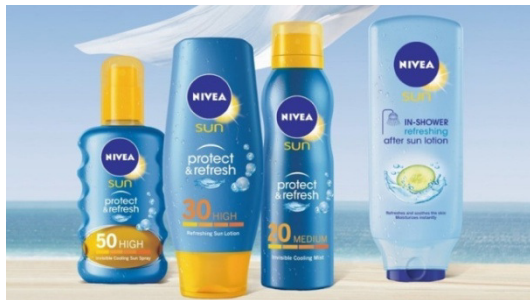
Slika 11: Nivea proizvodi za zaštitu od sunca