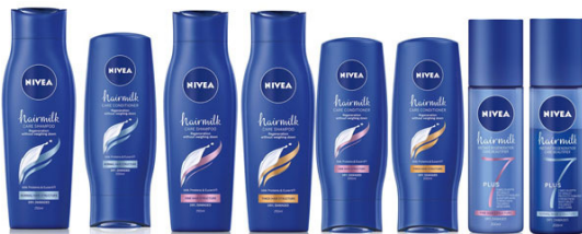
Slika 15: Nivea proizvodi za njegu kose