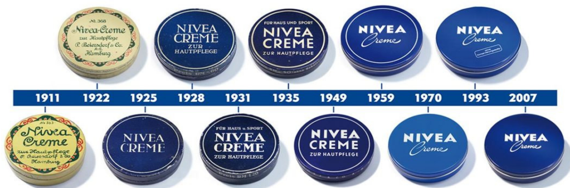
Slika 8: Izgled Nivea limenke od 1911. do 2007. godine