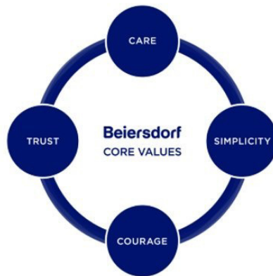
Slika1: Četiri temeljne vrijednosti poduzeća „Beiersdorf“