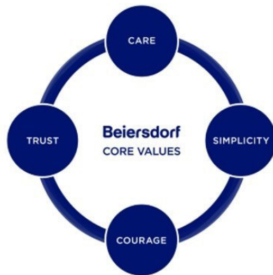
Slika1: Četiri temeljne vrijednosti poduzeća „Beiersdorf“