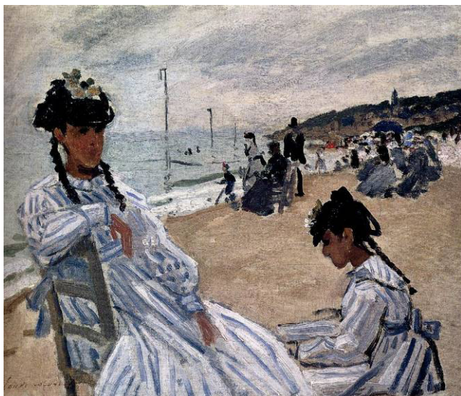
Slika 2. Cloude Monet, Na plaži Touville

Ondašnje provođenje vremena na plaži bilo je, pored ostaloga, organizirano u ozračju relaksacije, razgovora, odmora, šetnje i sličnoga. Plivanje i sunčanje, kao vodeće aktivnosti na plažama, nisu bile toliko popularne sve do kraja 19. stoljeća. Do tada su Sredozemlje posjećivali isključivo u zimskim razdobljima, iako su već od 17. stoljeća postojala saznanja u svezi blagodati morskog zraka i umakanja u morsku vodu, kao što je već i istaknuto. Međutim, sve do kraja 19. stoljeća postojala je određena razina straha od obalnih dijelova i mora, zbog činjenice da su se na ovim područjima vodili ratovi (Inglis, 2000: 26). Ovakva negativna percepcija postojala je još od antičkog doba.