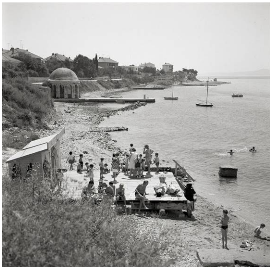
Slika 3. Fotografija kupanja u Zadru 1910-ih godina

U to vrijeme, na području Hrvatske praksa odmora i provođenja slobodnog vremena u turističke svrhe bila je razvijenija među inozemnim gostima, a značajno manje kod domaćeg stanovništva. To se nastojalo promijeniti putem intenzivnije promocije turizma i pripadajućih aktivnosti kroz tadašnje novine, među kojima svakako treba spomenuti časopis Turizam , novine Vjesnik i slične. Vrlo česte teme u okviru njih tada postaju odmaranje na plažama, kupanje u moru i ostalo. Upravo je to ukazalo na određenu razinu razvijenosti plaža u punome smislu, a o tome svjedoče brojni tadašnji članci, fotografije i ostali dokazi iz tog vremena (Duda, 2005: 111). Jedan od mnogo starijih primjera je fotografija iz 1910-ih koja pokazuje kako su se domaći i inozemni turisti odmarali na plažama u Zadru (Slika 3.).