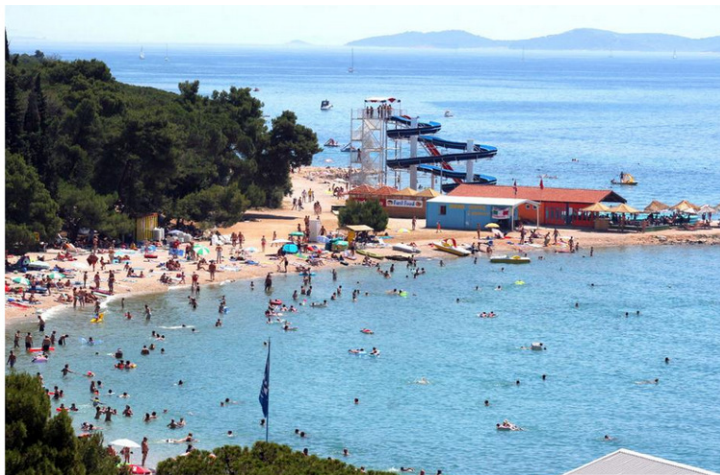
Slika 9. Plaža za djecu Veli žal na Lošinju

S druge strane, plaže za pse posebno su označene, a najčešće i ostale vrste, a često su smještene na nešto manje atraktivnim lokacijama gdje je prisutno visoko strujanje vode. U konačnici, plaže za djecu posebno su opremljene dječjim sadržajima, estetski su prilagođene i u praksi označene kao takve. Najčešće su to pješčane plaže smještene u uvalama, vrlo šarene i atraktivne, kvalitetno opremljene, sigurne i adekvatno uređene. Jedan od takvih primjera slijedi u nastavku (Slika 9.).