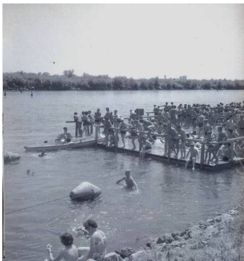
Slika 4. Savsko kupalište 1958. godine