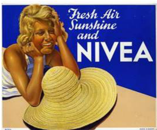
Slika 5. Međunarodni Nivea oglas iz 1934. godine motiviran zadovoljnom ženom na plaži

S razvojem plaža dolazi i do razvoja potrepština ili opreme za plažu. Pri tome se misli na pojavu krema za sunčanje i zaštitu od sunca oko 1960-ih godina, a o kojima su izvještavale razne novine o kojima je već bilo riječi. Jedan od takvih primjera u Hrvatskoj su Niveine kreme (Slika 5.).