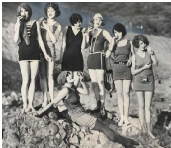
Slika 6. Kupaći kostimi početkom 20. stoljeća

Godine 1920. kupaći kostimi pod utjecajem francuskog stila bivaju reducirani na dugački top koji je prekrivao kratke hlače tzv. malliot . Osim toga, koristile su se i kape za kupanje izrađene od lateksa. Kape za kupanje postale su modna potreba tadašnjih kupačica. U narednih dvadesetak godina uslijedile su različite varijante ovakvih kupaćih kostima. Neki od njih bili su sačinjeni od sukunjice ili pregačice naprijed ili odzada koje su prekrivale kratke hlačice i odražavale ženstvenost. Ubrzo nakon toga javljaju se i prvi kupaći kostim s otkrivenim leđima, koji su osmišljeni radi dobivanja preplanulog tena, a čak je bilo dozvoljeno i spuštanje naramenica (Vintage, 2014). Prvi dvodijelni kupaći kostimi javljaju se četrdesetih godina 20. stoljeća, a svake godine oni postaju sve oskudniji i kraći (Slika 7.).