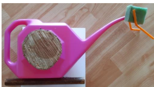
Foto 15: La lumaca (annaffiatoio, spugnetta, cannuce, pezzi di legno) - 3 anni