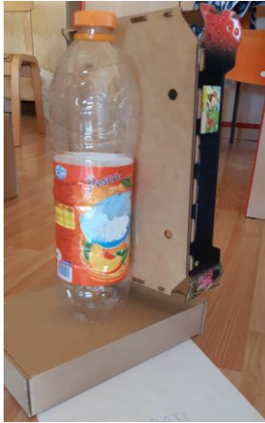
Foto 7: La nave dei pirati (scatolone, cassetta di legno, bottiglia) - 4 anni