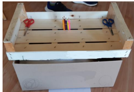
Foto 10: Una casa (scatolone, cuscino, cassetta di legno, matite colorate, forbici) - 6 anni