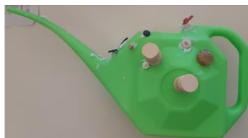
Foto 16: Il robot (annaffiatoio, tappi di sughero, bottoni) - 3 anni