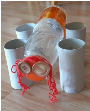
Foto 13: Un cavallo (bottiglia, giornale, bottoni, rotoloni, lana) - 3 anni