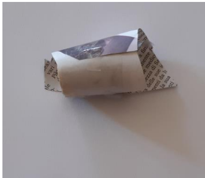
Foto 11: Un sasso pericoloso, (tappo di sughero, giornale) - 3 anni