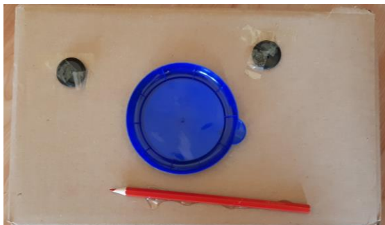
Foto 9: La scatola vivente (scatolone, bottoni, coperchio di plastica, matita colorata) - 5 anni