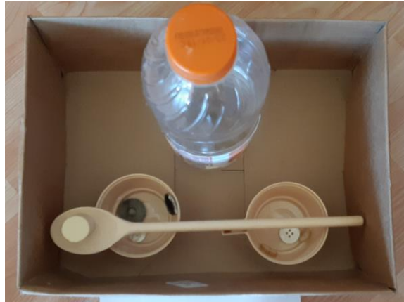
Foto 8: La spiaggia (scatolone, tazzine, mestolo di legno, bottoni, bottiglia) - 4 anni