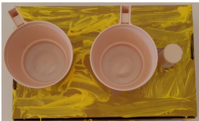
Foto 4: La cucina (scatolone, tazzine, tappo di sughero) - 3 anni