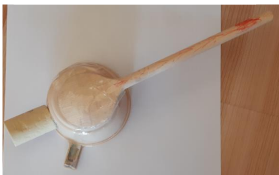
Foto 5: Cannone spara rete (tazzina, mestolo di legno, tappo di sughero) - 5 anni