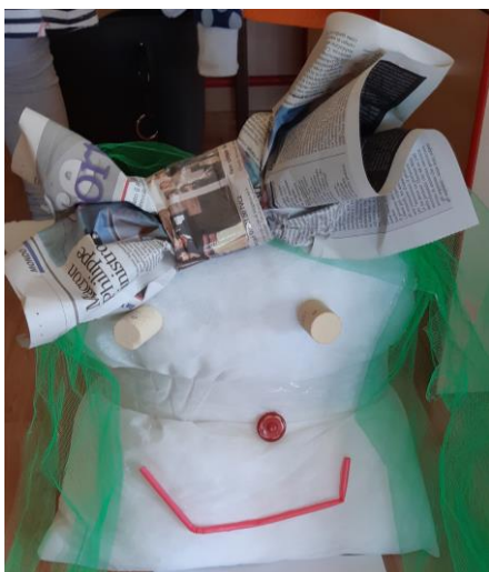
Foto 3: La bambina (cuscino, tappi di sughero, bottone, tulle, giornale) - 5 anni