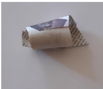
Foto 11: Un sasso pericoloso, (tappo di sughero, giornale) - 3 anni