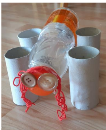
Foto 13: Un cavallo (bottiglia, giornale, bottoni, rotoloni, lana) - 3 anni