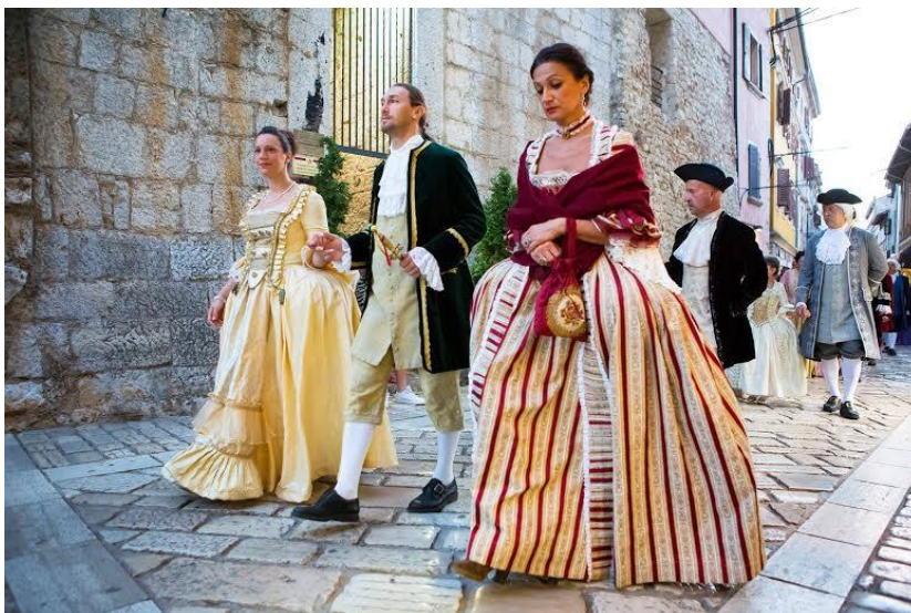
Slika 13. Ženske barokne haljine