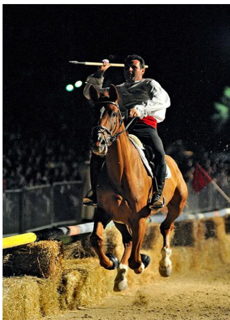
Slika 16. Konjanik