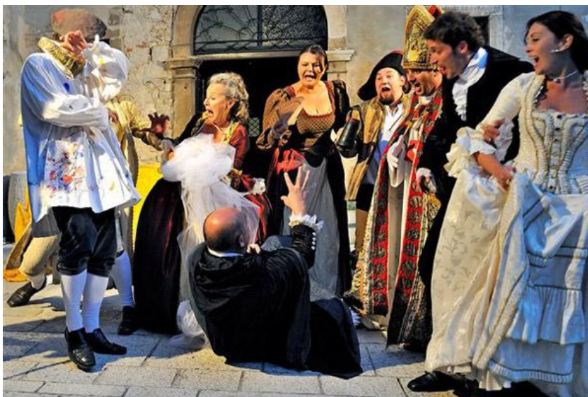
Slika 12. Dramska predstava