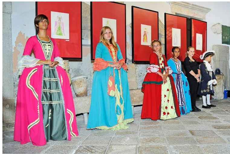
Slika 8. Budimo kreatori mode iz doba Giostre