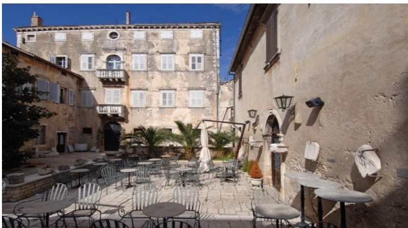
Slika 1. Dvorište lapidarija Muzeja