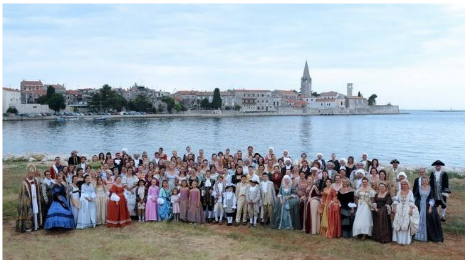
Slika 4. Prvo zajedničko fotografiranje članova Društva prijatelja Giostre