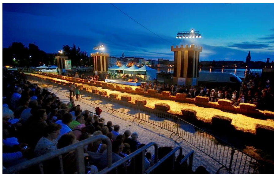
Slika 17. Trkalište u uvali Peškera