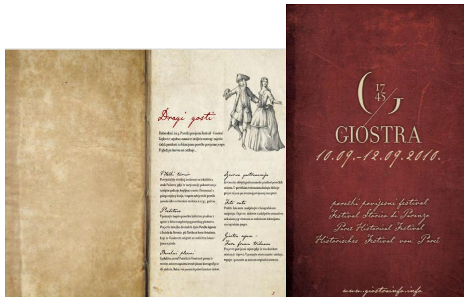
Slika 9. Programska knjižica Giostra