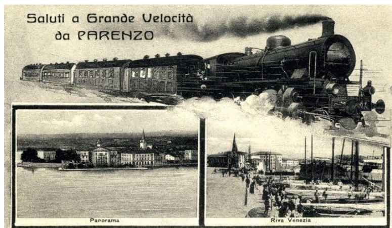
Slika 2. Poreč u 18. i 19. stoljeću

Izvor: http://www.idisturato.com/en/2017/08/24/continuous-hotel/ , Idis Turato (16. 2. 2018.)