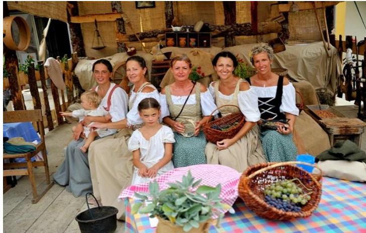
Slika 11. Presentacija starih običaja