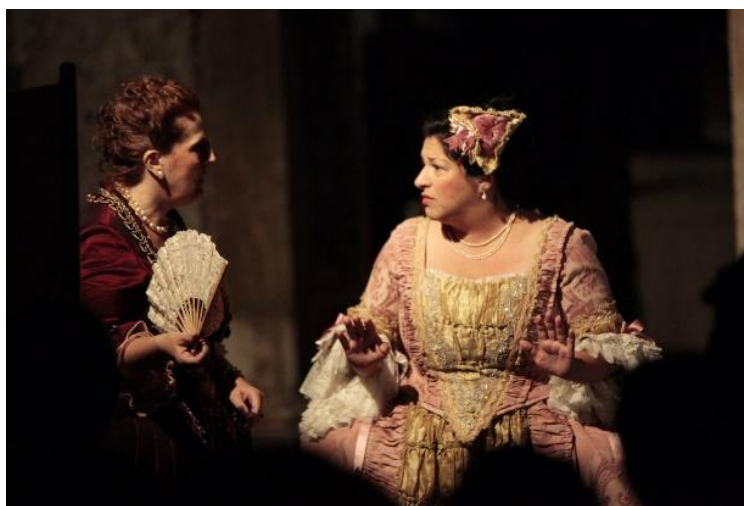
Slika 6. Scensko uprizorenje s Giostre