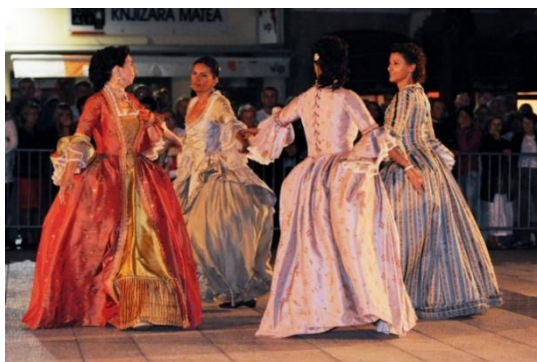
Slika 5. Barokni ples