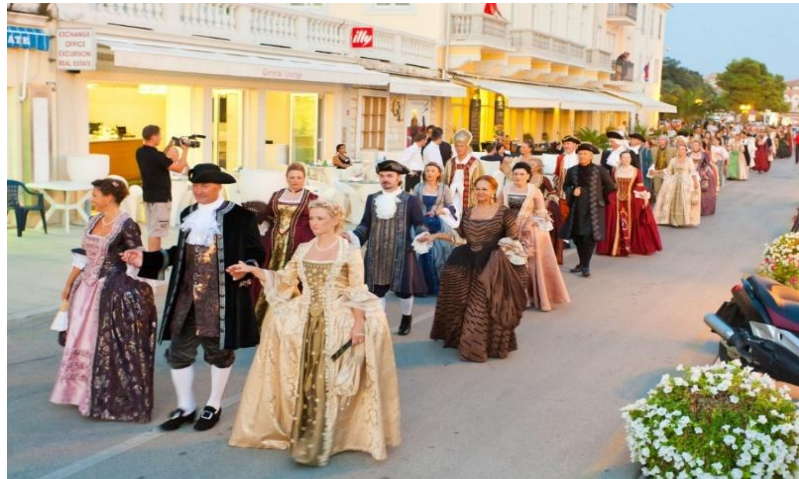
Slika 7. Članovi društva u baroknim kostimima