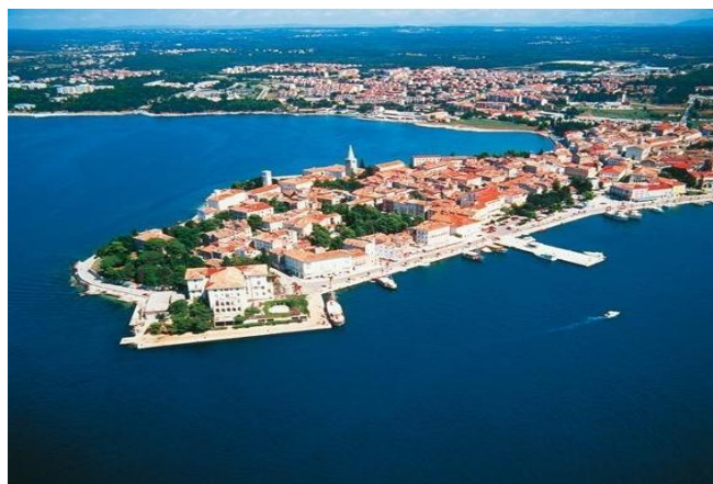
Slika 3. Poreč danas