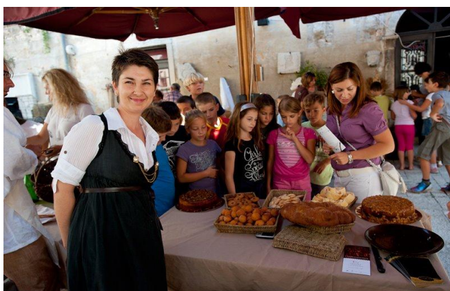
Slika 10. Sajam Giostre