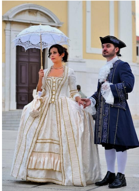
Slika 14. Barokni kostimi