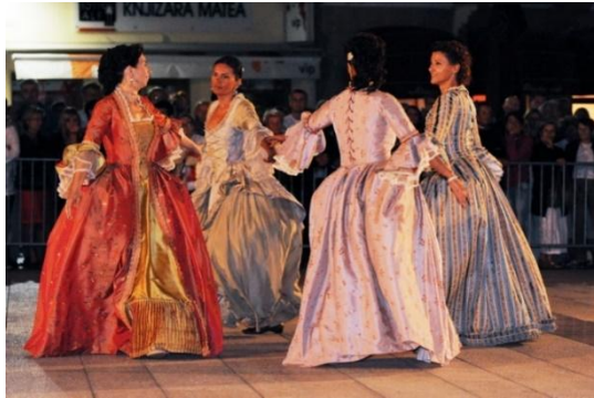
Slika 5. Barokni ples