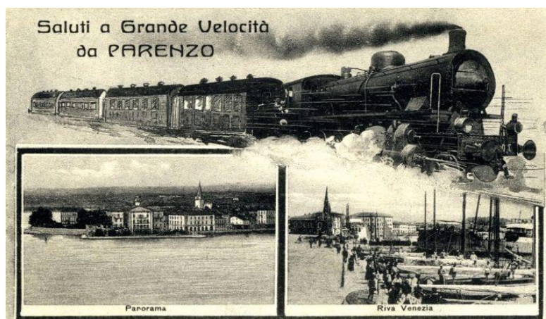
Slika 2. Poreč u 18. i 19. stoljeću