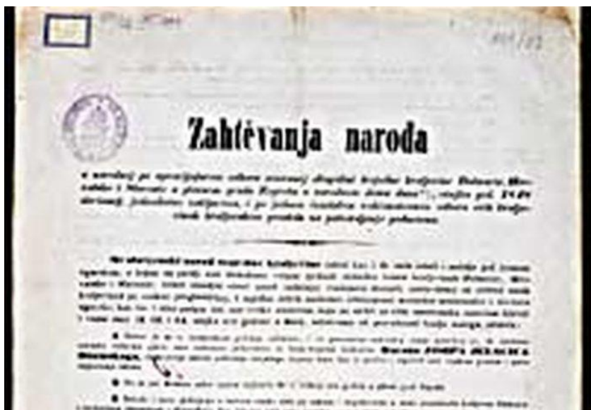
Prilog 3. Zahtjevanja naroda 42

koju je odlazilo gotovo polovica njihovog rada, a u doba najvećih radova, čak i do dvije trećine. Upravo zbog takvih „kmetova“, koji su bili u većini, ukinuće „drugog kmetstva“ odnosno tlake predstavljalo je za hrvatsko društvo u cjelini najvažniji i najočigledniji napredak u okolnostima revolucionarnih zbivanja. 40 Dana 5. lipnja iste godine, ban Jelačić saziva zasjedanje novog Hrvatskog sabora, a zasjedanje je trajalo sve do 9. srpnja. Neki od najistaknutiji izglasanih zaključaka su da se svi građani podliježu obvezi plaćanja poreza prema propisima koji bi ubrzo trebali biti doneseni, da se Dalmacija i Vojna granica ujedine s Banskom Hrvatskom te da ban, u slučaju obrambenog rata, ima sve ovlasti u interesu obrane i zaštite države. 41