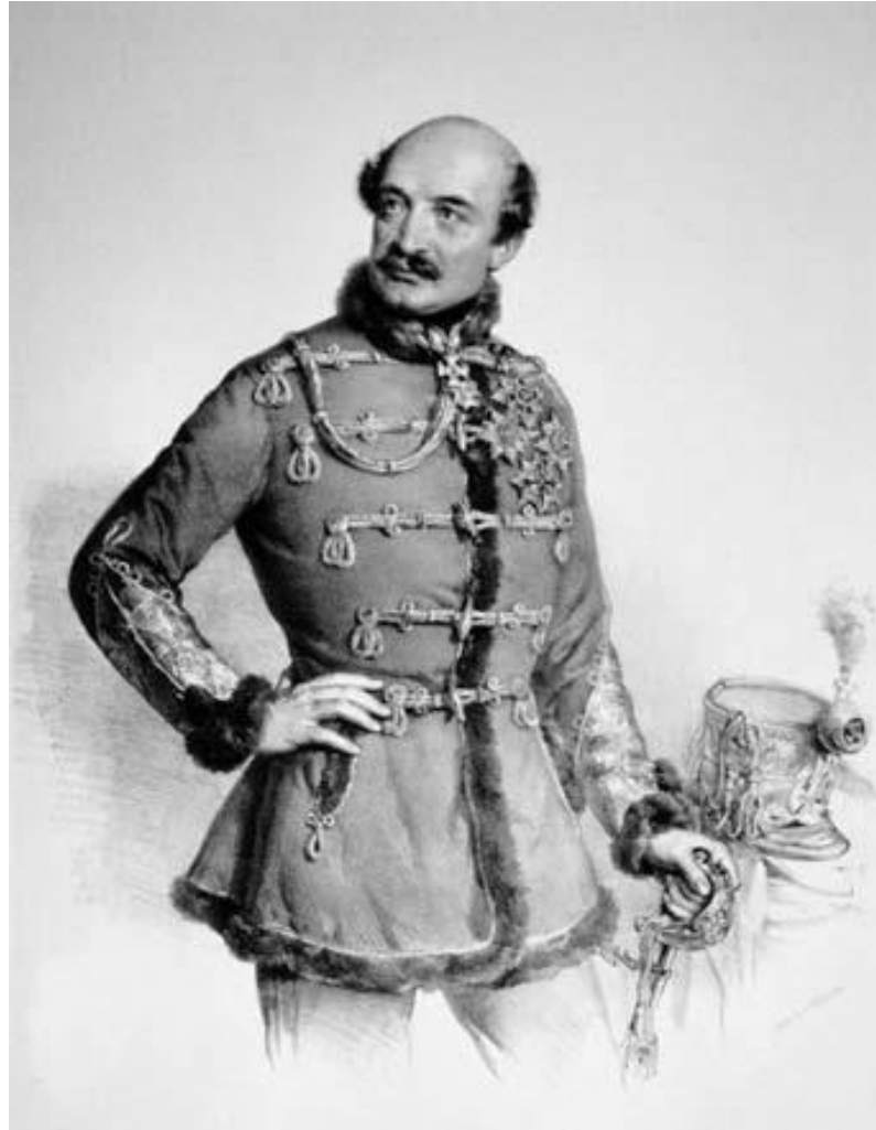
Prilog 2. portret Josipa Jelačića 33