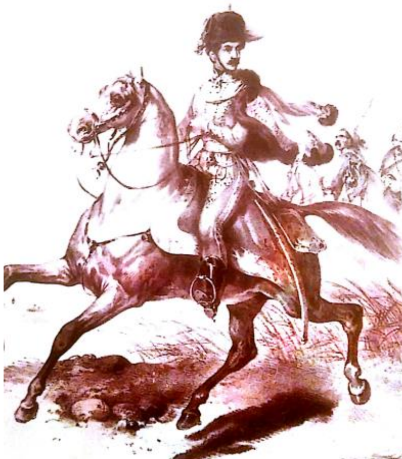
Prilog 1. Josip Jelačić u mladosti 27