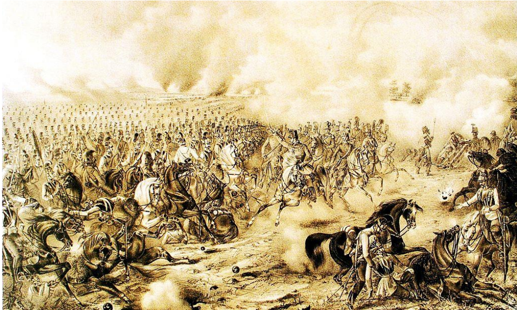
Prilog 5. Bitka kod Schwechata 61