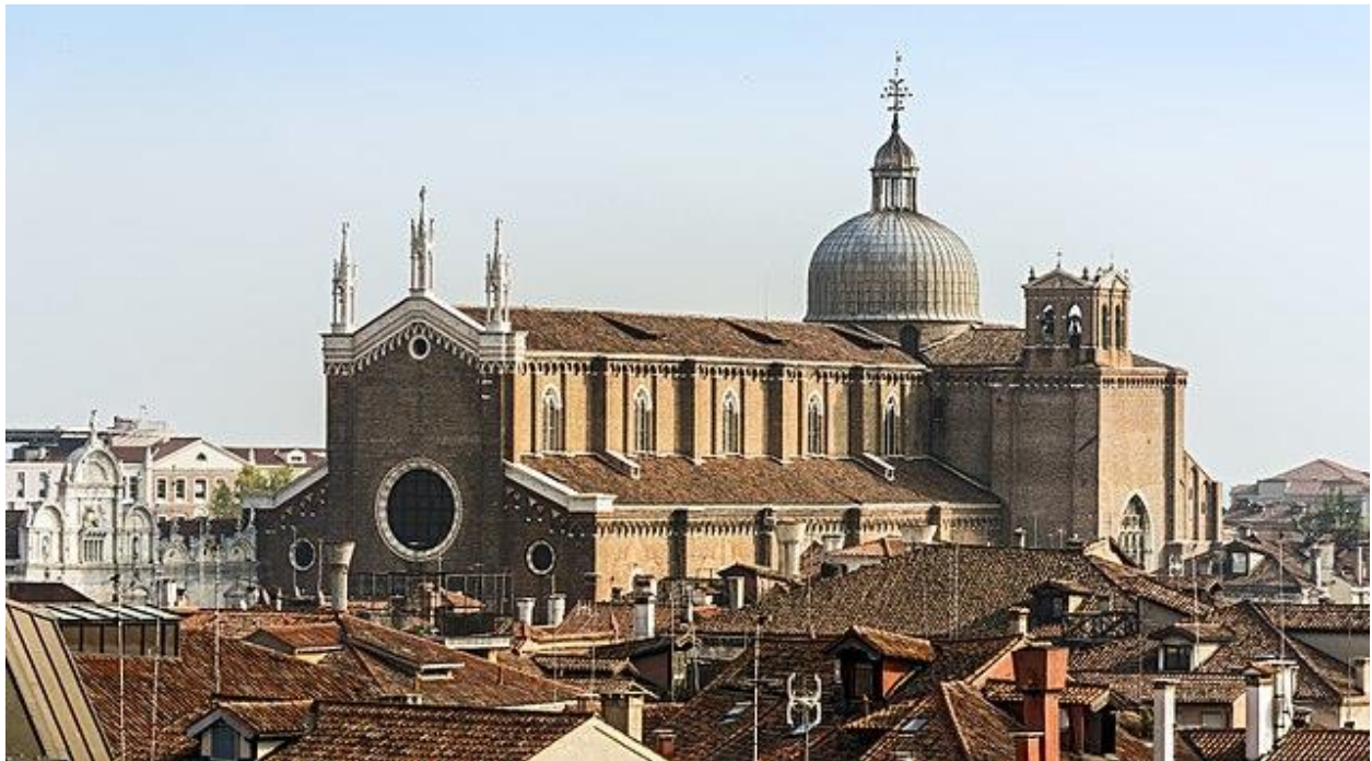
Slika 3. Crkva svetih Ivana i Pavla u Veneciji (02. 10. 2018.)