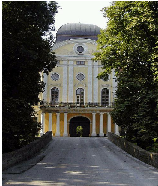
Slika 7 - Dvorac Pejačević u Virovitici