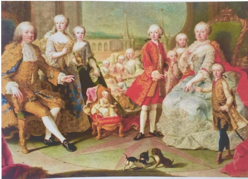
Slika 13. Marija Terezija i njezina obitelj (oko 1754.)