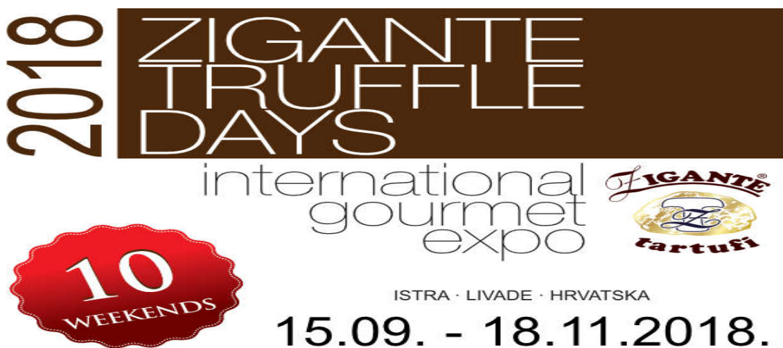
Slika 2. Dani tartufa 2018.