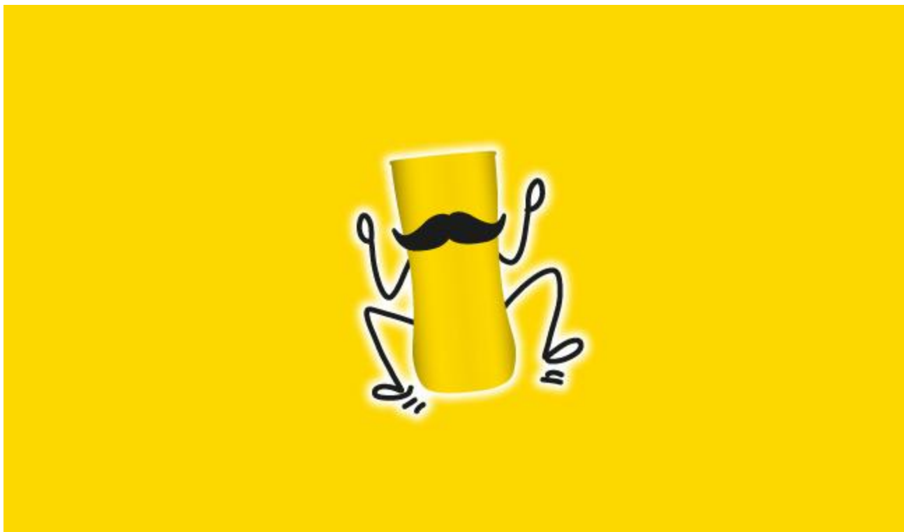
Slika 3. Najnovi logo Cedevite u obliku animacije