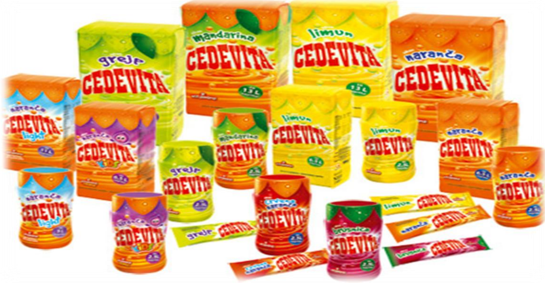
Slika 6: Mnogobrojni asortiman Cedevitinih proizvoda