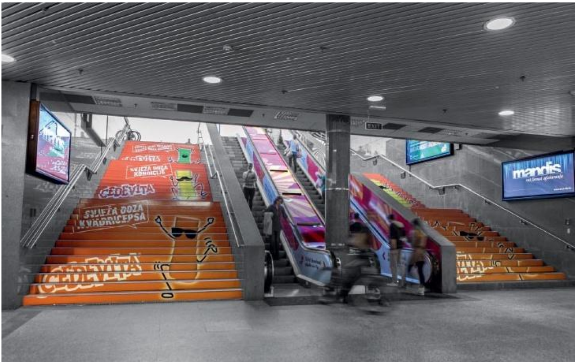
Slika 23: Primjer vanjskog oglašavanja