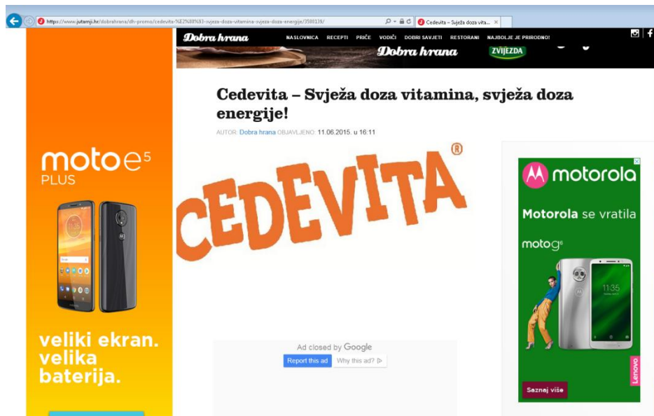
Slika 17: Primjer oglasa