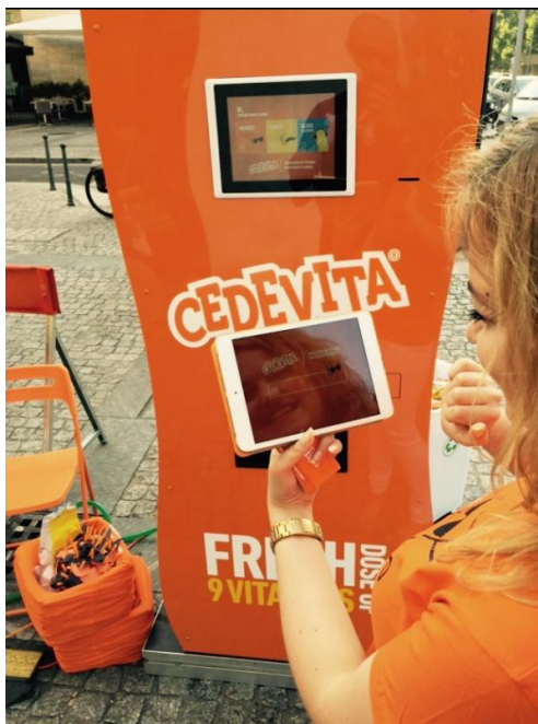
Slika 19: Primjer cedevita aparata

Cedevita vitamin point, kako nazivaju aparate, komunicirat će s potrošačima putem smartphonea ili tableta. Platforma je mobilna aplikacija, prilagođena operativnim sustavima Android i iOS. Cedevita Vitamins Point omogućuje korisniku da i izvan svog doma može doći do svježe doze vitamina vrlo jednostavno – uz pomoć svog smartphonea! 64