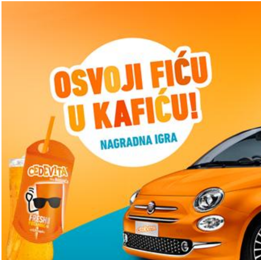
Slika 10: Vizualni identitet za nagradnu igru