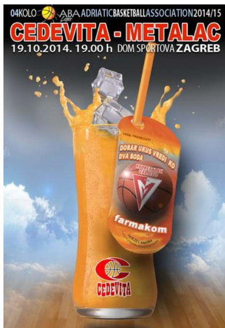
Slika 11: Prikaz Cedevitinog plakata