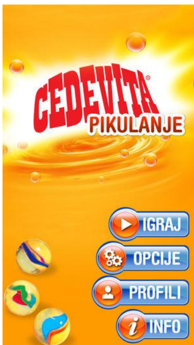
Slika 18: Primjer iPhone aplikacije “Cedevita pikulanje”

djetinjstvo, naučite svoju djecu ovoj igri ili jednostavno izazovite prijatelje u ovoj zabavnoj igri 63 .