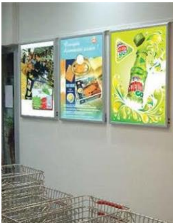
Slika 14. i 15: Prikaz plakata u trgovini, autobusnom stajalištu