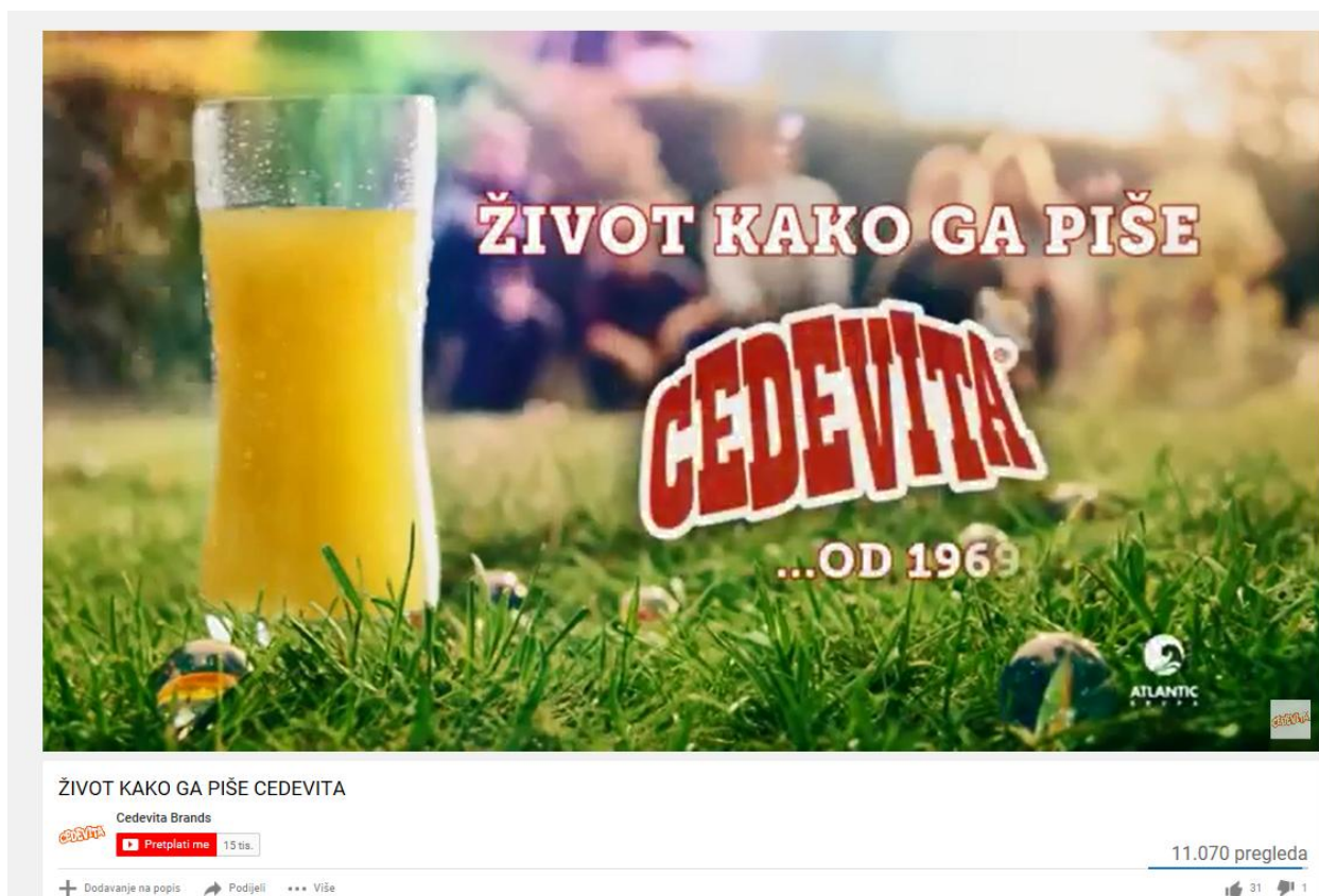
Slika 9: TV spot za Cedevida piće

Izvor: Youtube/Spot: Život kako ga piše Cedevida: https://www.youtube.com/watch?v=tQcYsnF9GzA (pristupljeno 15.lipnja 2018.)