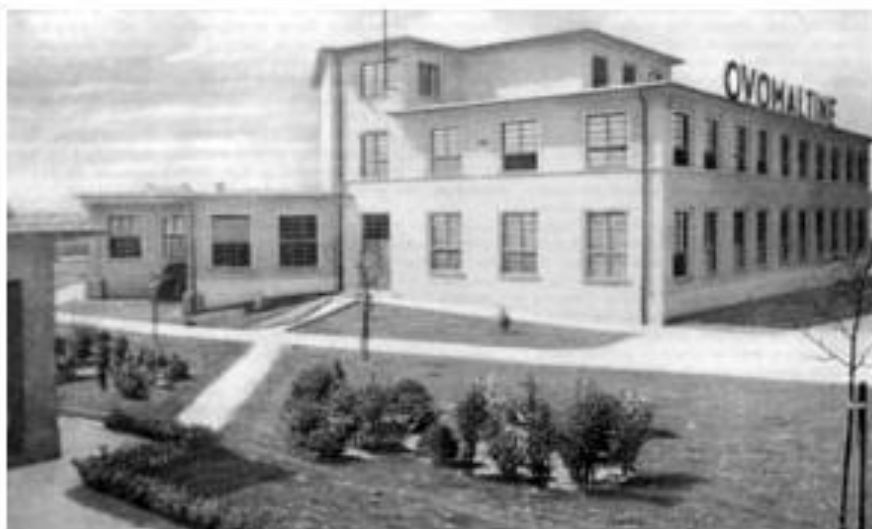
Slika 1. Tvornica Cede vite u Zagrebu u povijesti