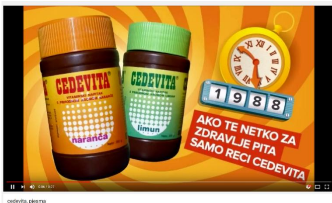
Slika 7: TV/radio spot