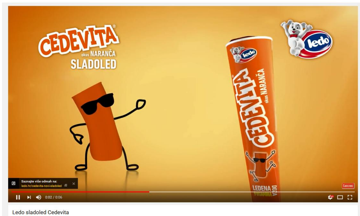
Slika 8: TV spot