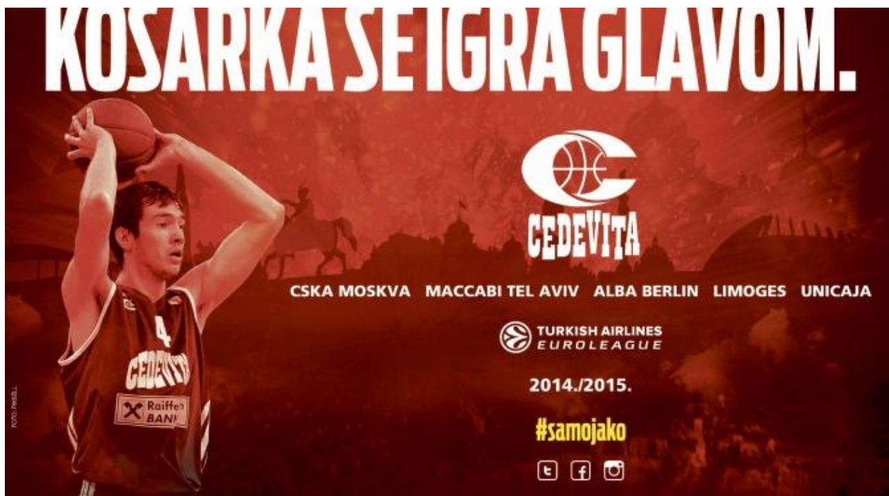
Slika:4. Sportski marketing (košarkaški klub Cedevita Zagreb)