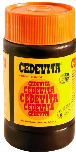
Slika 5. Prva bočica napitka Cede vite

52