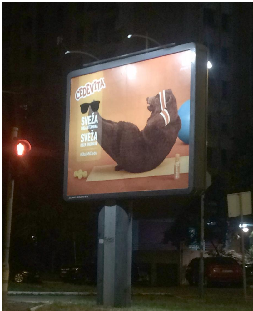
Slika 13: Prikaz billboard oglasa