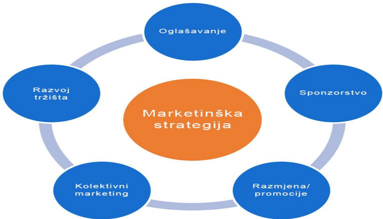
Slika 2: Marketinška strategija