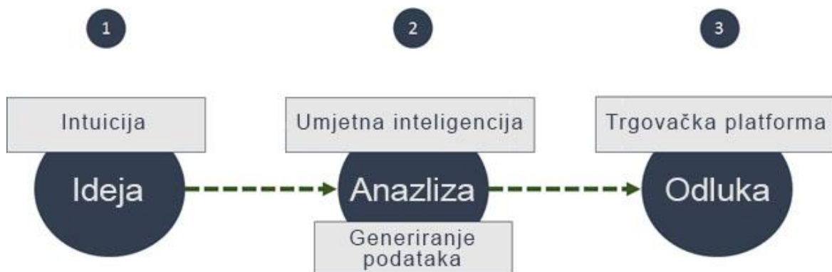
Slika 1: proces inovacijske analize