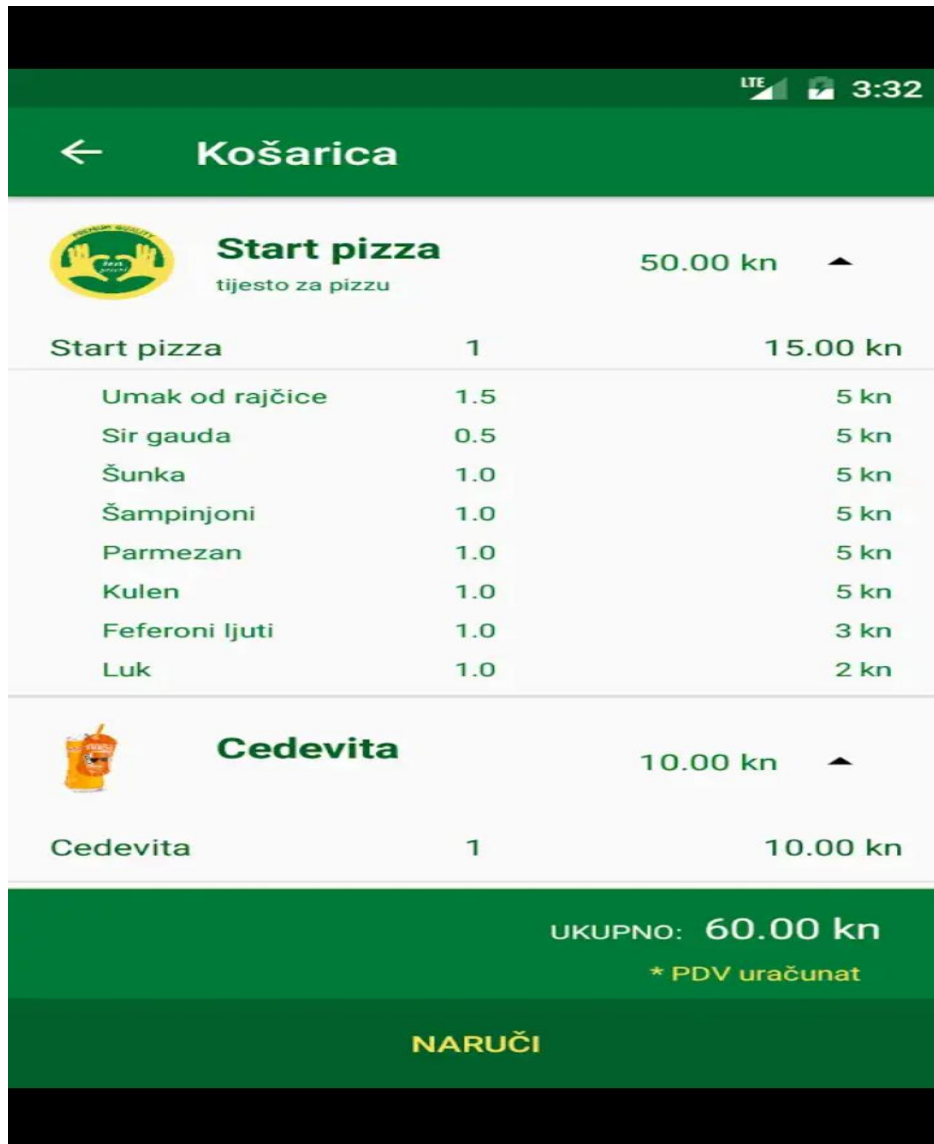
Slika 5 : Narudžba