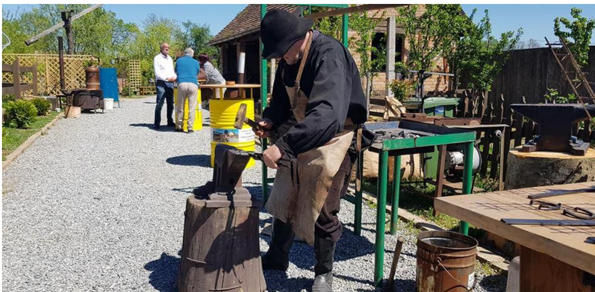
Slika 2. Demonstracija starih zanata na sajmu u Oprisavcima