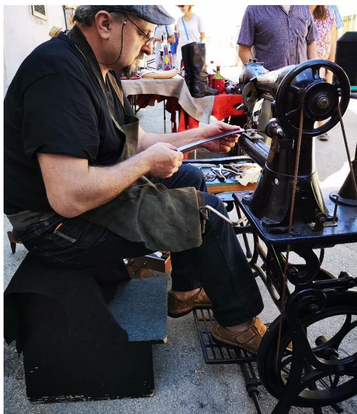
Slika 4. Demonstracija izrade remena