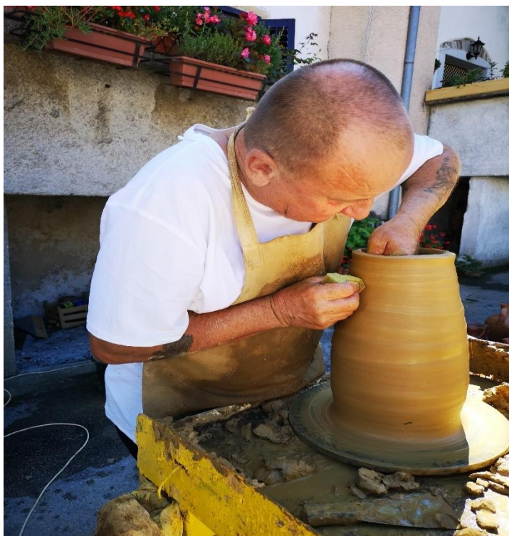
Slika 3. Demonstracija izrade lončarskih proizvoda (Buzet: 2018)