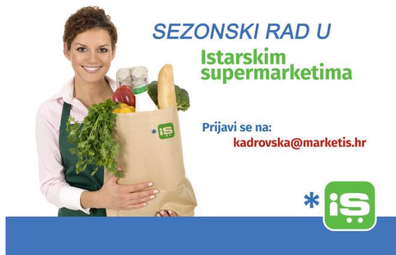
Slika 4. Primjer oglasa za posao