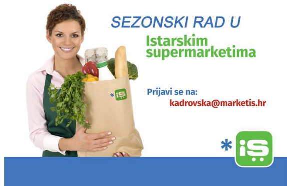
Slika 4. Primjer oglasa za posao