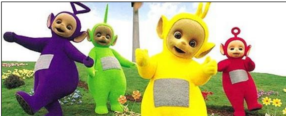
Slika 1: Teletubbies