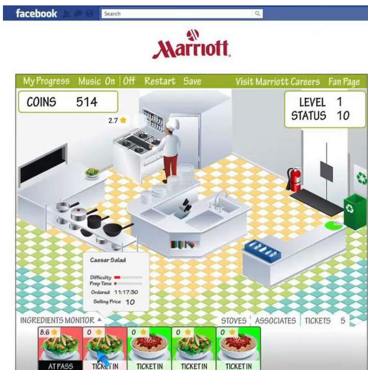
Slika 3: Marriott Hotel

Igra ne mora služiti samo za zapošljavanje i privlačenje ljudi. Također ju se može iskoristiti kasnije u svrhu određenih obuka i treninga zaposlenika. Razvitkom takve igre koja se može koristiti pri zapošljavanju, u svrhu opće obuke ili obuke za usavršavanje zaposlenika, znatno se smanjuju troškovi organizacije, jer se razvije jednom, a implementira više puta. To se i vidi u razvoju Marriott Hotel grupe.