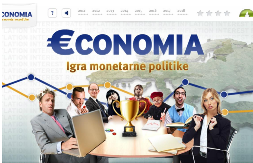
Slika 5: €conomia igra monetarne politike

U financijskom sektoru koriste se za obuku, privlačenje klijenata i da se zaposlenicima objasne kompleksni financijski procesi i financijska ponuda. €conomia je ozbiljna igra koja se temelji na monetarnoj politici Europske središnje banke. Koristi se kako bi naučila zaposlenike o utjecaju promjene kamatnih stopa na nezaposlenost, rast proizvodnje, inflaciju i druge vitalne gospodarske pokazatelje.