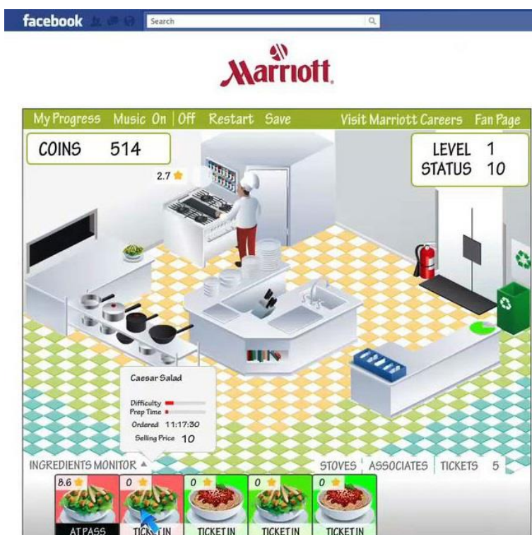
Slika 3: Marriott Hotel

Igra ne mora služiti samo za zapošljavanje i privlačenje ljudi. Također ju se može iskoristiti kasnije u svrhu određenih obuka i treninga zaposlenika. Razvitkom takve igre koja se može koristiti pri zapošljavanju, u svrhu opće obuke ili obuke za usavršavanje zaposlenika, znatno se smanjuju troškovi organizacije, jer se razvije jednom, a implementira više puta. To se i vidi u razvoju Marriott Hotel grupe.