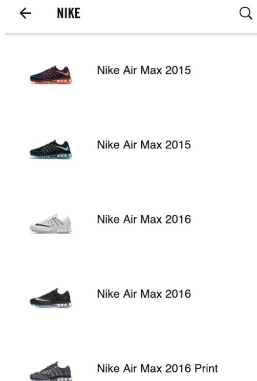
Slika 4: Nike promoviranje proizvoda u aplikaciji Nike+

Facebook igre su toliko popularne da ih organizacije koriste kao glavne marketinške alate. Kako za zapošljavanje, tako i za prodaju i promoviranje svojih proizvoda, razne organizacije uz pomoć ozbiljnih igara žele doprijeti do svojih poslovnih partnera, zaposlenika, klijenata i budućih klijenata. Kroz igru se organizacije na jedinstven način „obraćaju“ kupcima i potencijalnim kupcima te nude mogućnost prodaje svojih proizvoda i usluga. Time čine vrijednosti tvrtke jasnijima i primamljivijima. Određene organizacije ozbiljne igre koriste kako bi predstavile svoje proizvode i usluge ili možda dobile određenu povratnu informaciju na temelju koje bi mogli unaprijediti ponudu i uslugu.