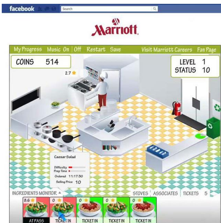
Slika 3: Marriott Hotel

Igra ne mora služiti samo za zapošljavanje i privlačenje ljudi. Također ju se može iskoristiti kasnije u svrhu određenih obuka i treninga zaposlenika. Razvitkom takve igre koja se može koristiti pri zapošljavanju, u svrhu opće obuke ili obuke za usavršavanje zaposlenika, znatno se smanjuju troškovi organizacije, jer se razvije jednom, a implementira više puta. To se i vidi u razvoju Marriott Hotel grupe.