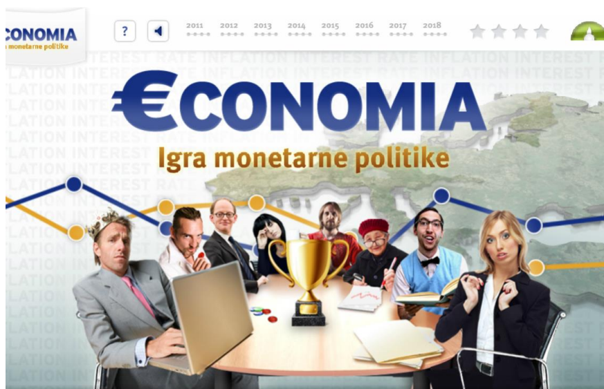
Slika 5: €conomia igra monetarne politike

U financijskom sektoru koriste se za obuku, privlačenje klijenata i da se zaposlenicima objasne kompleksni financijski procesi i financijska ponuda. €conomia je ozbiljna igra koja se temelji na monetarnoj politici Europske središnje banke. Koristi se kako bi naučila zaposlenike o utjecaju promjene kamatnih stopa na nezaposlenost, rast proizvodnje, inflaciju i druge vitalne gospodarske pokazatelje.