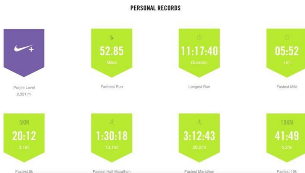
Slika 8: Bedževi u Nike +, Izvor: https://www.wareable.com/running/nike-plus-run-club-guide-how-to-use-running-430 (21.08.2018)

Nike+ je jedan od poznatijih primjera igre koja bilježi veliku količinu potencijalnih kupaca koji bi mogli i ostati u kontaktu s tvrtkom. Nike+ je aplikacija razvijena kako bi nadopunila najviše nestrukturirani sport na planetu - trčanje. Ova platforma prikuplja osobne podatke od korisnika u cilju praćenja i prikazivanja najnovijih postignuća i cijelog napretka. Nike+ korisnicima omogućuje usporedbu i natjecanje s ljudima iz cijelog svijeta, uključujući izravne prijatelje kada su povezani s društvenim medijima. Razvijen sustav igara omogućio je prikupljanje velikih količina podataka tijekom dugog razdoblja, nakon čega su uspješno segmentirali i prodavali svoje proizvode i usluge izravno. Sve prikupljene informacije omogućile su i povećanje produktivnosti odjela za istraživanje i razvoj, te online marketinga. Nike+ je bio tako uspješan da je glavni okvir izgrađen i proširen od strane mnogih drugih tvrtki. Trčanjem igrači osvajaju određene značke vezane za razne segmente trčanja kao što bi bila najduža ili najbrža pretrčana udaljenost, a trčeći i prelaskom sve većeg broja kilometara korisnik prelazi na više levele. Što su karakteristike ozbiljnih igara. Također Nike+ daje mogućnost da korisnik odabere u kojim Nike tenisicama trči čime potiču kupnju svojih proizvoda.