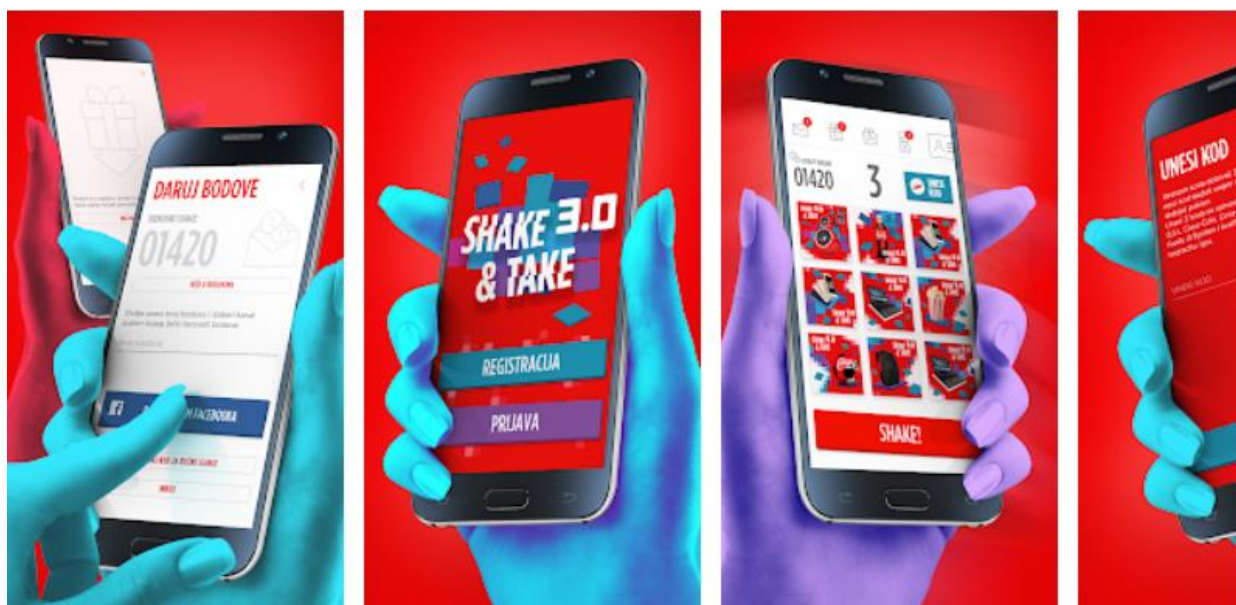
Slika 9: SHAKE&TAKE 3.0_Coca-Cola; Izvor: https://play.google.com/store/apps/details?id=com.AplikacijaReklame.ShakeCoke (15.09.2018)

Među poznatim kompanijama je svakako i Coca-Cola. Kompanija koja je poznata i po svojim jedinstvenim reklamama. Spojila je medije, pametne telefone i gamifikaciju u jedno, pod nazivom „Shake it“. U Hong Kongu, tinejdžerima je ponuđena markirana aplikacija za njihove telefone. Tijekom večernjih sati na televiziji bi se puštala reklama tijekom koje su mogli pokrenuti aplikaciju i tresući svoj pametni telefon skupljati popuste kod partnera kao što je McDonald's. Igra izaziva znatiželju kod korisnika zbog čega je teško odoljeti igri, a usklađenom igrom s misijom, kompanija povećava interakciju s mladim ljudima.