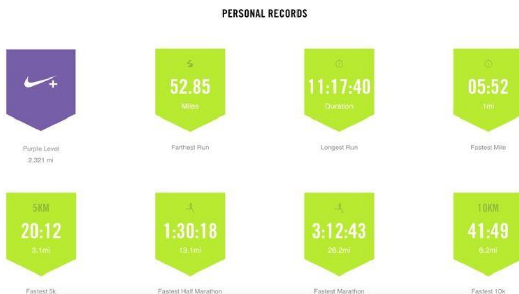
Slika 8: Bedževi u Nike +

Nike+ je jedan od poznatijih primjera igre koja bilježi veliku količinu potencijalnih kupaca koji bi mogli i ostati u kontaktu s tvrtkom. Nike+ je aplikacija razvijena kako bi nadopunila najviše nestrukturirani sport na planetu - trčanje. Ova platforma prikuplja osobne podatke od korisnika u cilju praćenja i prikazivanja najnovijih postignuća i cijelog napretka. Nike+ korisnicima omogućuje usporedbu i natjecanje s ljudima iz cijelog svijeta, uključujući izravne prijatelje kada su povezani s društvenim medijima. Razvijen sustav igara omogućio je prikupljanje velikih količina podataka tijekom dugog razdoblja, nakon čega su uspješno segmentirali i prodavali svoje proizvode i usluge izravno. Sve prikupljene informacije omogućile su i povećanje produktivnosti odjela za istraživanje i razvoj, te online marketinga. Nike+ je bio tako uspješan da je glavni okvir izgrađen i proširen od strane mnogih drugih tvrtki. Trčanjem igrači osvajaju određene značke vezane za razne segmente trčanja kao što bi bila najduža ili najbrža pretrčana udaljenost, a trčeći i prelaskom sve većeg broja kilometara korisnik prelazi na više levele. Što su karakteristike ozbiljnih igara. Također Nike+ daje mogućnost da korisnik odabere u kojim Nike tenisicama trči čime potiču kupnju svojih proizvoda.