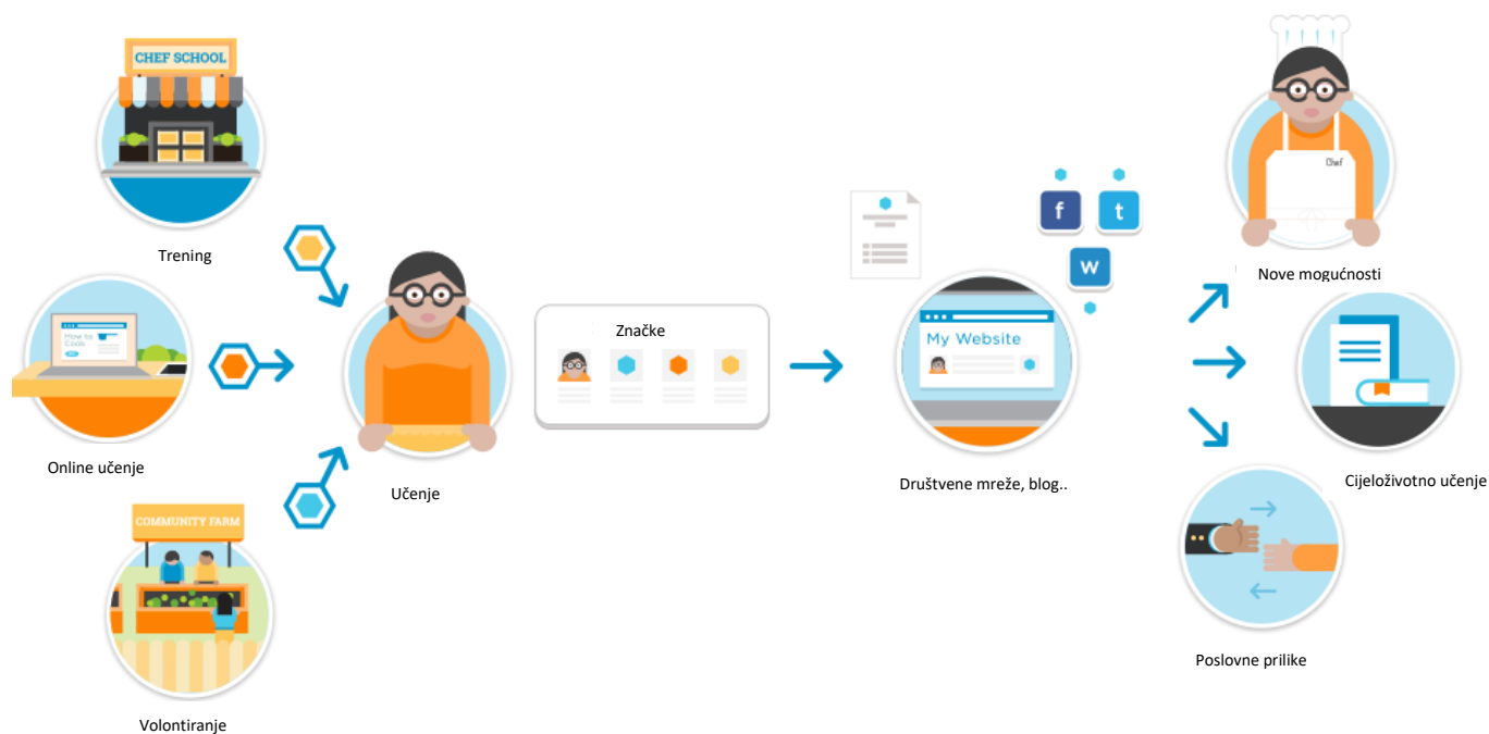
Slika 10: prikupljanje i dijeljenje znački

Neke takve organizacije nude mogućnost izdavanja znački koje možete dijeliti na društvenim mrežama, stranicama, blogovima al ih možete navesti i u svom životopisu pri traženju posla. Značaka koju posjedujete simbolizira određene vještine koje ste stekli u određenoj organizaciji. Jedne od takvih znači su „Otvorene značke“ odnosno pod originalnim nazivom Open Badges koje se mogu steći preko nekoliko tisuća organizacija diljem svijeta.