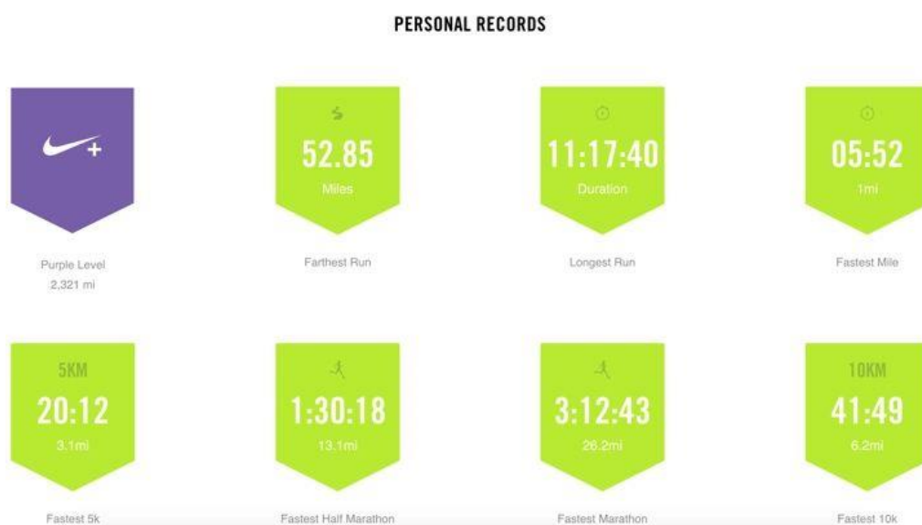
Slika 8: Bedževi u Nike +

Nike+ je jedan od poznatijih primjera igre koja bilježi veliku količinu potencijalnih kupaca koji bi mogli i ostati u kontaktu s tvrtkom. Nike+ je aplikacija razvijena kako bi nadopunila najviše nestrukturirani sport na planetu - trčanje. Ova platforma prikuplja osobne podatke od korisnika u cilju praćenja i prikazivanja najnovijih postignuća i cijelog napretka. Nike+ korisnicima omogućuje usporedbu i natjecanje s ljudima iz cijelog svijeta, uključujući izravne prijatelje kada su povezani s društvenim medijima. Razvijen sustav igara omogućio je prikupljanje velikih količina podataka tijekom dugog razdoblja, nakon čega su uspješni segmentirali i prodavali svoje proizvode i usluge izravno. Sve prikupljene informacije omogućile su i povećanje produktivnosti odjela za istraživanje i razvoj, te online marketinga. Nike+ je bio tako uspješan da je glavni okvir izgrađen i proširen od strane mnogih drugih tvrtki. Trčanjem igrači osvajaju određene značke vezane za razne segmente trčanja kao što bi bila najduža ili najbrža pretrčana udaljenost, a trčeći i prelaskom sve većeg broja kilometara korisnik prelazi na više levele. Što su karakteristike ozbiljnih igara. Također Nike+ daje mogućnost da korisnik odabere u kojim Nike tenisicama trči čime potiču kupnju svojih proizvoda.