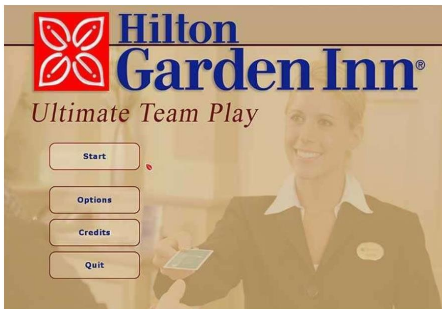
Slika 7: Hilton Garden Inn Ultimate Team Play igra;