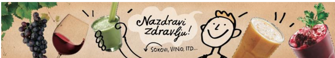
Slika 5. Komunikacija bio&bio trgovina

Izvor: Bio&bio trgovina http://bruketa-zinic.com/hr/2014/02/19/biobio-rebranding-2/ (pristupljeno 24. kolovoza 2018.)