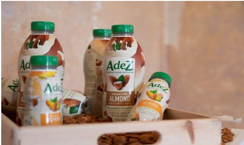
Slika 3. AdeZ