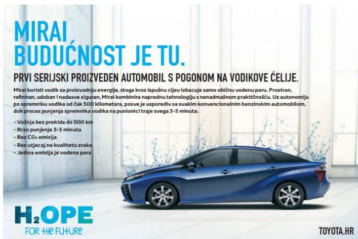
Slika 8. Toyota Mirai