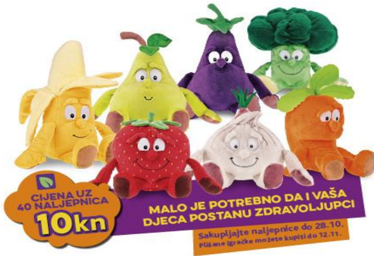
Slika 4. Zdravoljupci