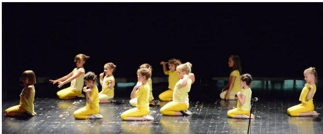
Slika 8. Koreografija „Minions“