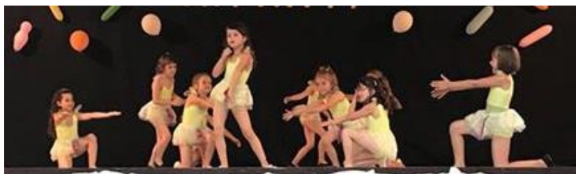
Slika 7. Grupa