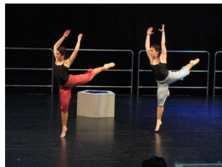
Slika 6. Duo