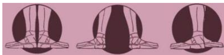
Slika 1. Prve tri pozicije u baletu

U izvođenju baletnih pozicija obično dodajemo i plié - polako savijamo koljena i ravnih se leđa spuštamo u polučučanj.