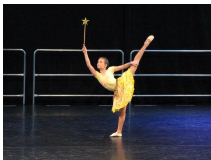
Slika 5. Solo

Plešući u ranoj dobi djeca rade na svom samopouzdanju, u čemu im uvelike pomaže prezentacija naučene koreografije.