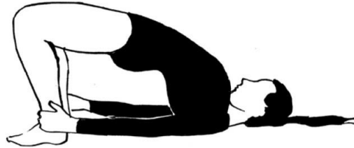
Slika 4. „Mali most“

Izvodimo ga ležeći na leđima. Noge su razdvojene u širini kukova i savijene u koljenu, rukama obuhvaćamo zglobove nogu te podižemo zdjelicu što je više moguće čineći most. Pazimo da ne podižemo pete s poda.