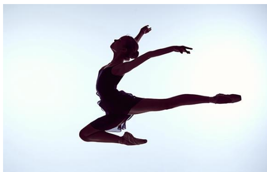
Slika 3. Jelenji skok

Izvodi se na način da su ruke u abdukciji, te činimo korak sa desnom nogom, pa s lijevom nogom, zatim podižemo desnu nogu pruženu u stopalu te dotičemo lijevo koljeno koje kao da guramo prema nazad. Desna zamašna noga ostaje prednožno zgrčena, a lijeva je pruženo zanožena.