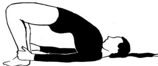
Slika 4. „Mali most“

Izvodimo ga ležeći na leđima. Noge su razdvojene u širini kukova i savijene u koljenu, rukama obuhvaćamo zglobove nogu te podižemo zdjelicu što je više moguće čineći most. Pazimo da ne podižemo pete s poda.