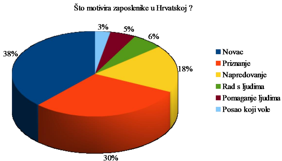
Graf 1. Što motivira zaposlenike u Hrvatskoj ?

Portal MojPosao proveo je nekoliko anketa, koje se odnose na motivaciju i nagrađivanje zaposlenih u Hrvatskoj. Kada su provjeravali da li je priznanje jednako važno za obavljen posao, kao i plaća, istraživanje su proveli na 1100 ispitanika (graf 1.).