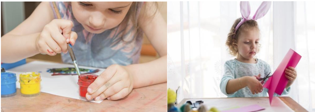
Slika 4. Poticanje senzomotorike

Potom slijedi faza preciznije senzomotorike. Ona započinje u petoj, a završava u desetoj godini života. U ovoj fazi gibanja su najmanje filogenetski uvjetovana. Za razliku od faze osnovne senzomotorike, vidljivo je da se precizniji i usklađeniji rad mišića ruku, šaka i prstiju kod bilo kojih pokreta, kretnji i gibanja. Pojavljivanjem faze preciznije senzomotorike dijete preciznije počinje baratati predmetima, započinje ljepše crtati, pisati slova, brojke i slično. Razvoj preciznije senzomotorike potiče se crtanjem, rezanjem, lijepljenjem, oblikovanjem papira ili kartona.