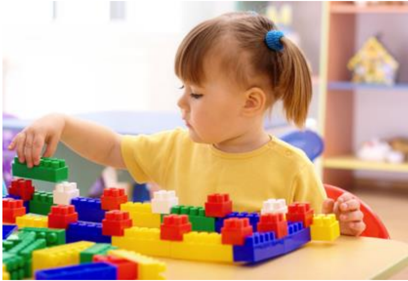
Slika 7. Igre stvaranja

se uključuju kocke, plastelin, rezanje lijepljenje, izrađivanje predmeta od raznih materijala.