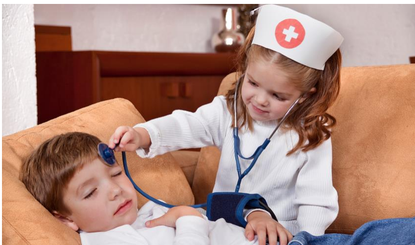
Slika 6. Igre pretvaranja

Igre pretvaranja pojavljuju se oko druge godine života pa sve do četvrte ili pete godine. Djeca u takvim igrama najčešće koriste simbole ili predmete koji se ne koriste pravilno. Najčešće je tema takvih igra odnos majke i oca, liječnika i sl.