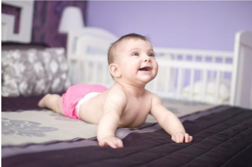
Slika 3. Držanje glave