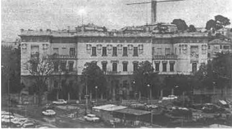
9. Fotografija Pedagoška akademija u Puli