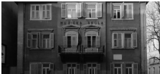
8. Fotografija Glazbena škola "Ivan Matetić Ronjgov"

obljetnice djelovanja, 2000. godine škola dobiva Povelju grada Pule za izvanredni doprinos razvoju glazbenog obrazovanja i trajno sudjelovanje u glazbeno-kulturnim djelatnostima grada Pule, a tako i same Istarske županije. 18