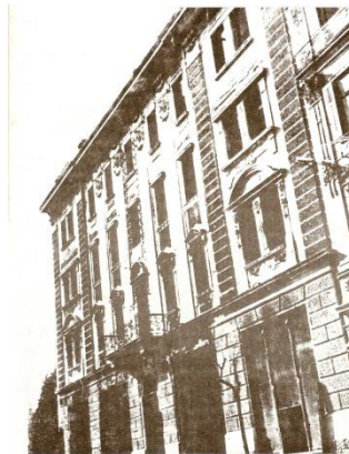
3. Fotografija zgrade u kojoj je bio smješten Narodni dom

Kulturno-umjetnički život odvijao se i u Narodnom domu u kojem su se okupljali Hrvati i Slovenci. Tu su djelovala domaća društva Prvi Istarski Sokol , Dalmatinski skup , Skup Slovenaca , Hrvatsko pjevačko i glazbeno društvo , Narodna radnička organizacija i dr. koja su često, između ostalog, pripremala zabave i koncerte.