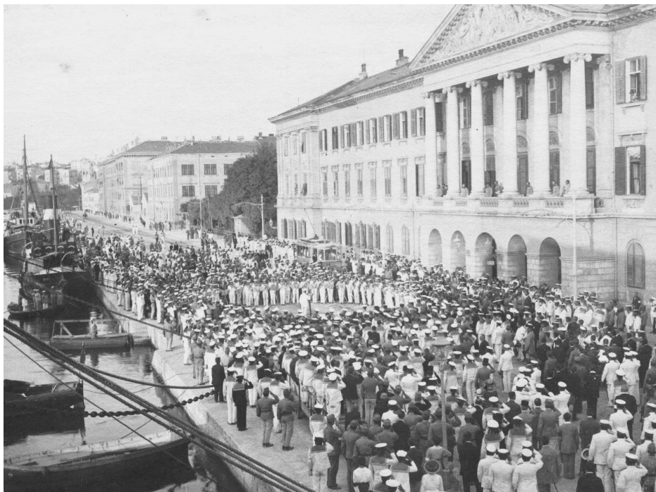
4. Fotografija Mornaričkog orkestra na Rivi početkom 20. st.

Kulturno-umjetnički život odvijao se i na Forumu. Tu je uz Mornarički orkestar austrougarske vojske održavala nastupe i talijanska Banda cittadina. 2