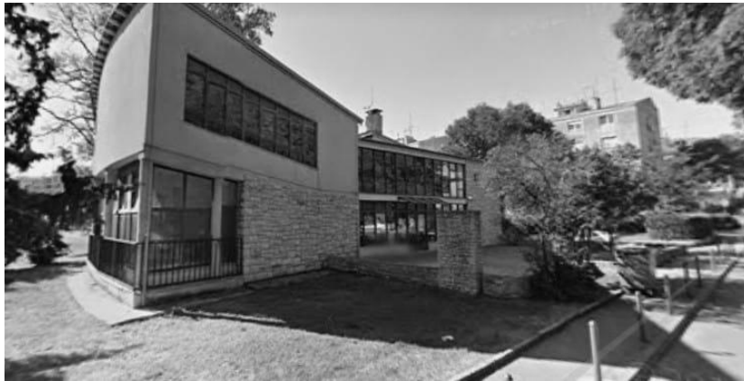
10. Fotografija Muzička akademija u Puli