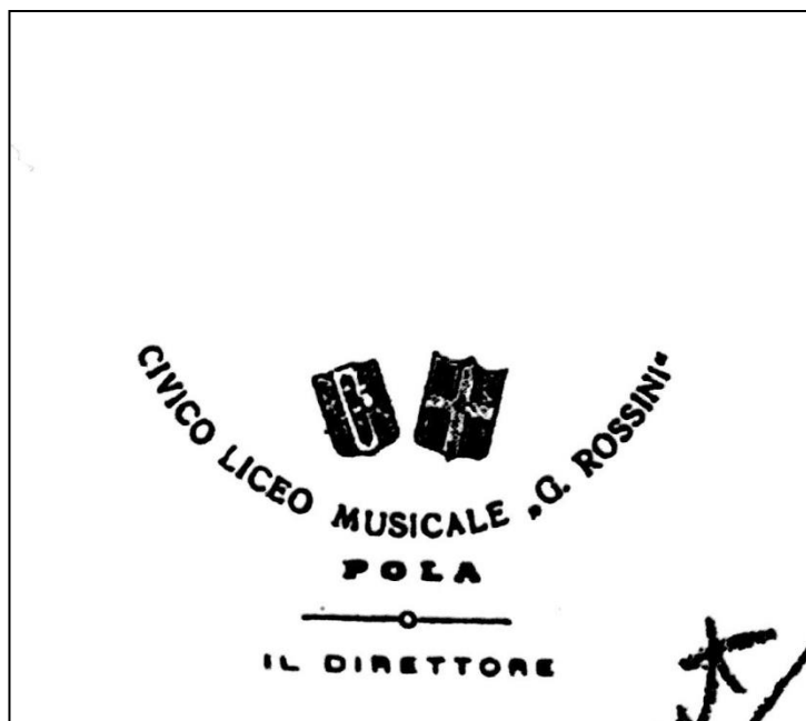
5. Fotografija pečata Glazbenog liceja Gioachino Rossini

Rad ustanove bio je međutim praćen mnogobrojnim problemima povezanim s formalno-pravnim statusom. Iako je škola radila prema nastavnom programu ministarstva školstva, nije bila izjednačena s državnim glazbenim institutima, pa joj je školski inspektorat osporavao pravo da izdaje diplome i svjedodžbe. Škola je rješavanje problema prepustila prefektu (gradonačelniku) a on je pak tražio mišljenje od nadležnog Ministarstva koje je dozvolilo da da privatna glazbena institucija izdaje diplome, koje međutim mogu vrijediti samo kao potvrda završenih glazbenih studija i nemaju značenje pravnoga akta, tj. nisu izjednačene s diplomama koje izdaju državni glazbeni instituti. Unatoč što škola nije imala službenu dozvolu za upotrebu imena "gradska", niti je bila financirana iz sredstava gradskog proračuna, općina se nije protivila uporabi imenu ni korištenju gradskog pečata. Nakon 1936. godine ni u dnevnome tisku ni u arhivskim vrelima nema podataka o njezinu djelovanju. 12