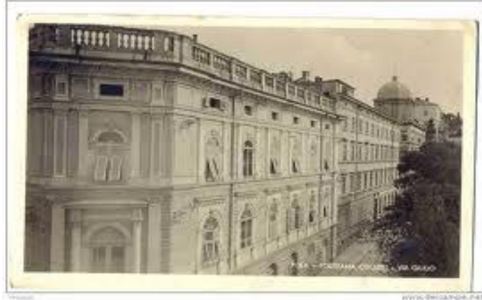
2. Fotografija Politeame Ciscutti sa stare razglednice

Kulturno-umjetnički život odvijao se i u Narodnom domu u kojem su se okupljali Hrvati i Slovenci. Tu su djelovala domaća društva Prvi Istarski Sokol , Dalmatinski skup , Skup Slovenaca , Hrvatsko pjevačko i glazbeno društvo , Narodna radnička organizacija i dr. koja su često, između ostalog, pripremala zabave i koncerte.