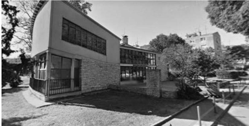
10. Fotografija Muzička akademija u Puli