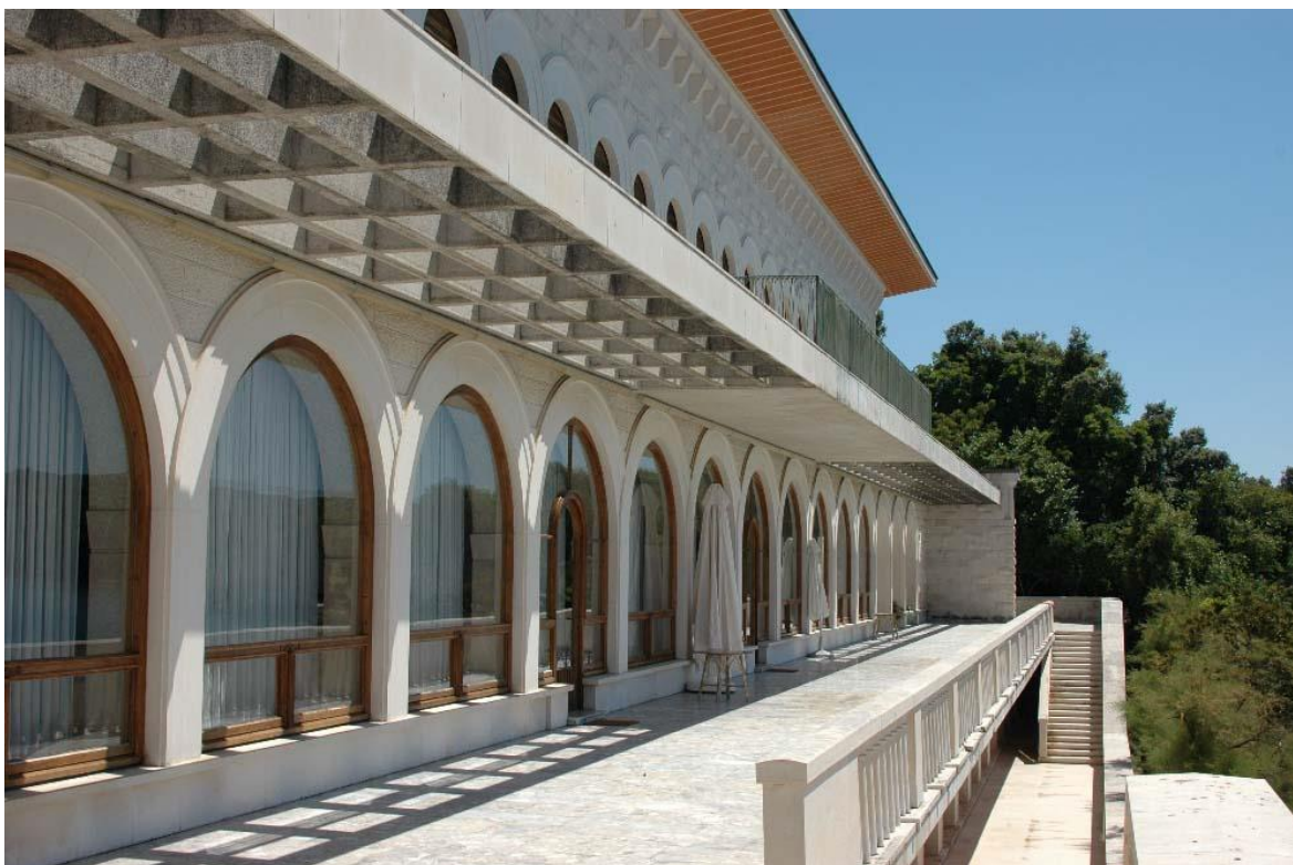
Slika 4. Vila Brijunka