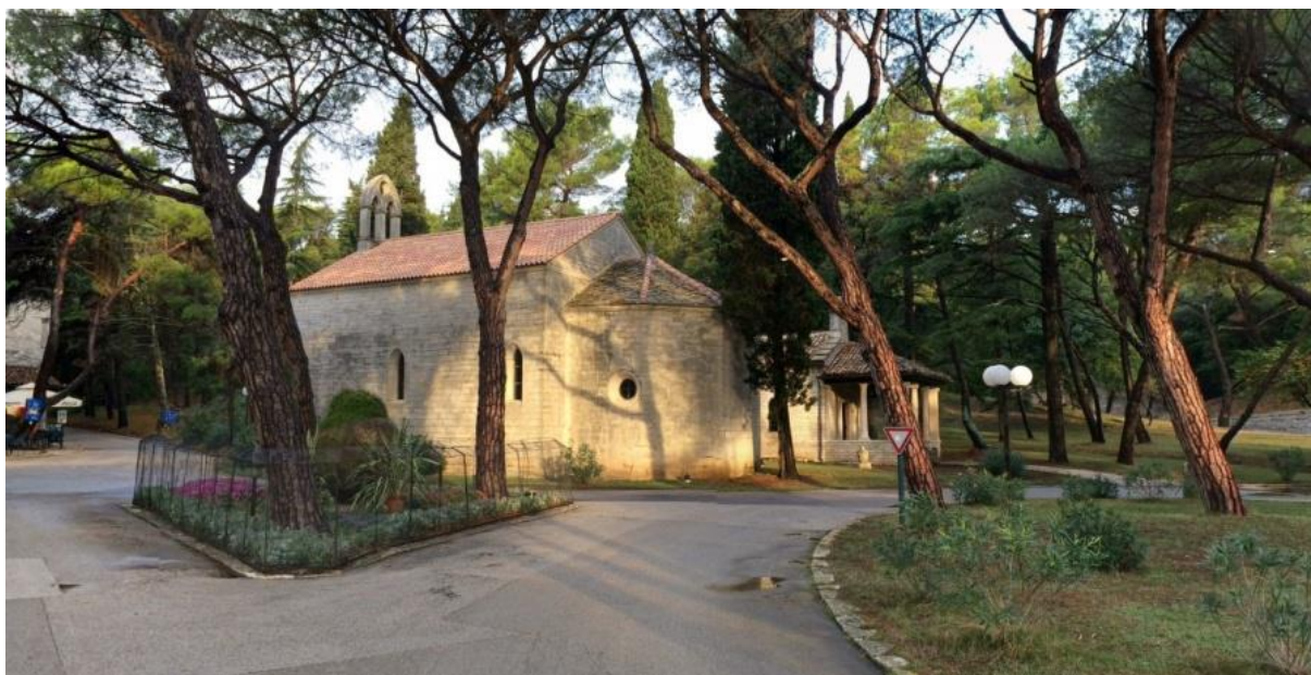
Slika 3. Crkva sv. Germana na Velom Brijunu

Paulu Kupelwieseru koji je i stvorio današnji imidž otoka. 72 Neki od glavnih motiva Brijuna su prizori na otoku koji su postali prave znamenitosti koje se mogu naći na mnogim fotografijama. Upravo su takvi zaštitni znakovi Brijuna ono što privlači nove goste na ovaj otok. 73