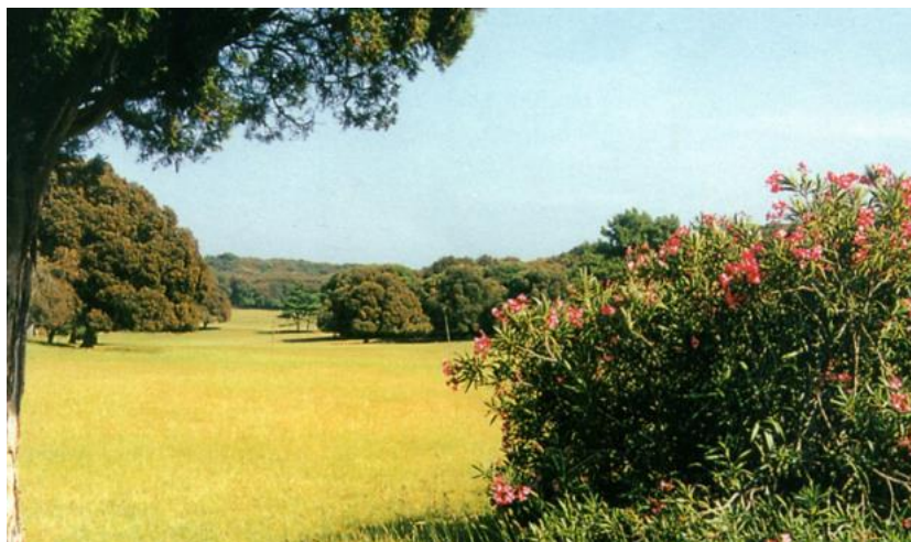
Slika 2. Oleandar uz Gradinu

obuhvaća velik broj egzotičnih životinja koje tamo slobodno žive. 54 Zbog očuvanja prirode, na otočju je moguće kretati se samo pješice, biciklom, solarnim automobilom ili solarnim vlakom iz kojeg se mogu razgledavati životinje. 55 Zoološki vrt, koji je dugi niz godina bio posebna atrakcija ovog područja, danas ne postoji jer su životinje prebačene u zoološke vrtove na kopnu. 56 Na poluotoku Peneda smješten je rezervat za rijetke ptičje vrste, a na gotovo cijelom području Velog Brijuna nalazi se engleski pejzažni park s početka 20. stoljeća. Park je izradio šumar Alojz Čufar, koji je u njega uklopio palme, oleandre, livade i brojne druge vrste grmova i stabala. U pejzažnom parku svoje mjesto je našla i stoljetna raspuknuta maslina te brijunski kamenolomi. 57 Osim prirodnih atrakcija, na otocima se nalaze i muzeji i galerije, a u tvrđavi Brioni Minor, na Malom Brijunu, tijekom ljeta se održavaju kazališne predstave kazališta Ulisyes. 58