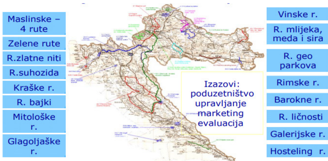
Slika 6.: Kulturne rute u Hrvatskoj - projekt „Kulturni tematski putovi“

Kulturne rute u Hrvatskoj koje su nastale projektom „Kulturni tematski putovi“ prikazane su na slici 6.