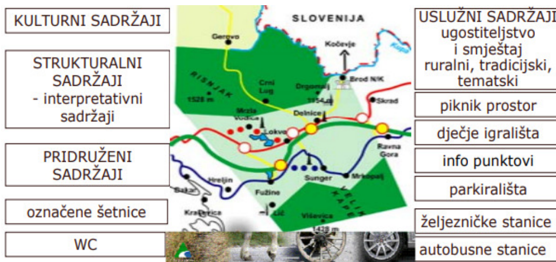
Slika 5.: Sadržaji rute kao tematizirane kulturno turističke atrakcije