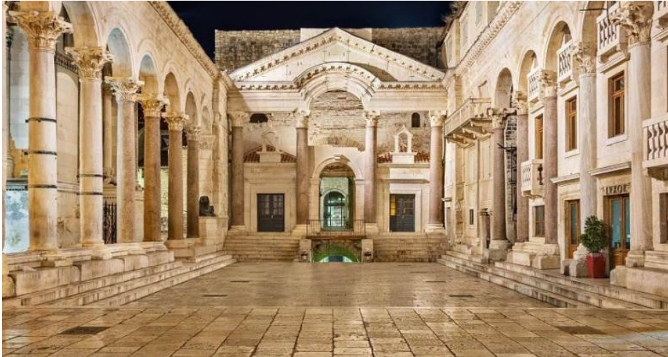
Slika 3.: Dioklecijanova palača u Splitu