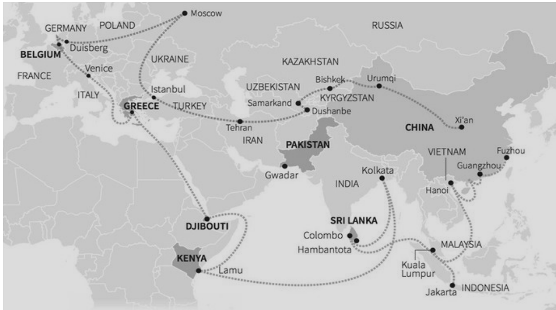
Slika 7.: Put svile – kartografski prikaz

Neke od europskih država koje ruta obuhvaća su Rusija, Njemačka, Bjelorusija, Belgija, Poljska, Ukrajina, Turska, Italija i Grčka.