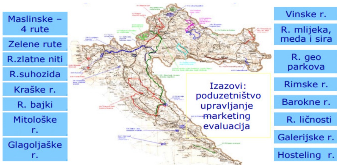
Slika 6.: Kulturne rute u Hrvatskoj - projekt „Kulturni tematski putovi“

Kulturne rute u Hrvatskoj koje su nastale projektom „Kulturni tematski putovi“ prikazane su na slici 6.