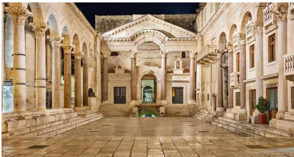
Slika 3.: Dioklecijanova palača u Splitu