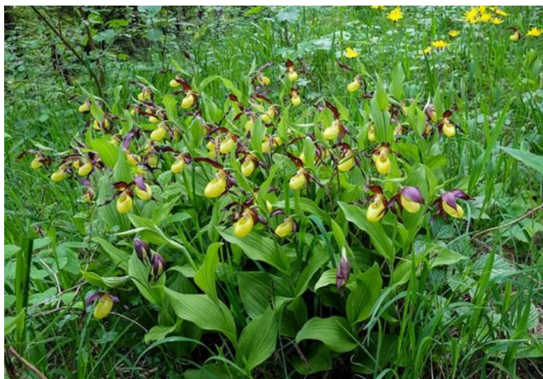
Slika 3. Gospina papučica

su ove vrste često istrebljivane, pa zbog toga i vrlo rijetke. Zastupljene su i neke endemične i ugrožene vrste flore. Iako endemi čine svega 1,7% vrsta na prostoru Parka, oni nisu nevažni i zanemarivi. Neke od endemičnih vrsta su livadni procjepak, krški kukurijek i hrvatski karanfil, te šupaljka. Za razliku od endemičnih, na ugrožene vrste otpada gotovo 5% sve flore Plitvičkih jezera. Neke od njih su zlatna jezičnica, koja je kritično ugrožena na globalnoj razini, te joj je Park jedino nalazište na prostoru jugoistočne Europe, ali i puzavi celer. Također, poznate su i tri biljke mesožderke, od kojih je kritično ugrožena vrsta pod nazivom obična tustica, dok su ostale dvije, okruglolisna rosika i mala mješinka. 24