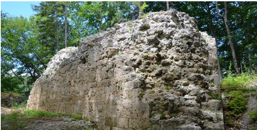
Slika 4. Gradina Krčingrad

Unatoč postojanju mnogih arheoloških lokaliteta, većina njih nije istražena i ne koriste se u turističke svrhe. Jedan od bolje istraženih objekata kulturno-povijesne baštine je gradina Krčingrad, poznata i kao gradina Kozjak. Smještena je na poluotoku između Kozjaka i Gradinskog jezera, a specifična je po svojoj trokutastoj kuli, kakva postoji na još samo tri lokacije u Europi, što ju čini rijetkim primjerom srednjovjekovne arhitekture. 29 Ova se gradina nalazi na Listi preventivno zaštićenih kulturnih dobara.