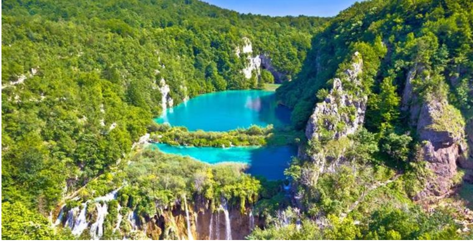
Slika 2. Jezero Novakovića Brod ( https://www.svesnizeno.hr/ , 28.7.2018.)

novi slapovi i kaskade. 16 Uz pomoć algi i mikroorganizama, taloženjem kristala kalcijevog karbonata iz vode, nastaju sedrene barijere. 17 Neki od brojnih slapova nastalih tim procesom su i Veliki slap, te slapovi Milke Trnine, imenovani po hrvatskoj opernoj pjevačici koja je, krajem 19. stoljeća, donirala novac tadašnjem Društvu za uređivanje i poljepšanje Plitvičkih jezera. 18