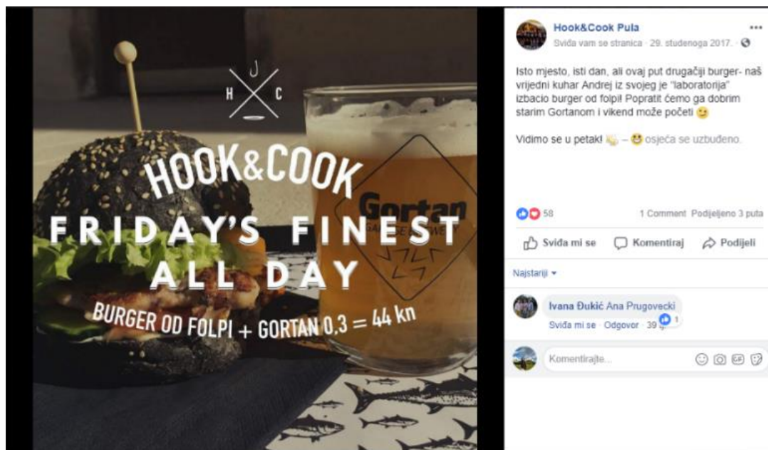
Slika 2. Prikaz jedne od fotografija sa Facebook profila Hook & Cook Pula