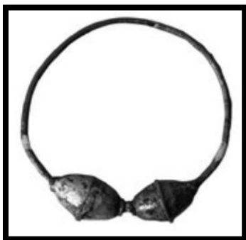
Slika 3. Autohtoni žminjski ričin