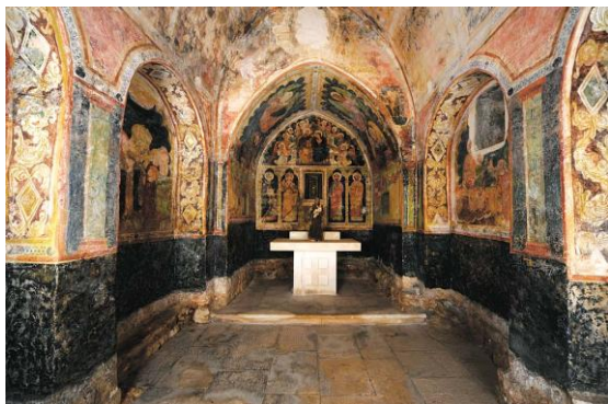
Slika 4. Freske na zidovima Crkve sv. Antuna