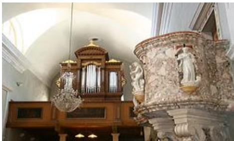
Slika 8. Orgulje u Crkvi sv. Mihovila

Izvor: http://www.tzzminj.hr/HRV/vodic/index.asp , 31.07.2018.