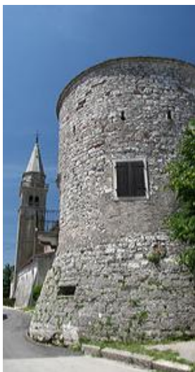
Slika 6. Žminjska kula