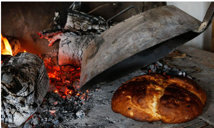
Slika 12. Priprema pince na starinskom ognjištu pod pekom