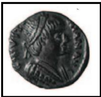
Slika 2. Srebrni novčić gotskog kralja Vitiga