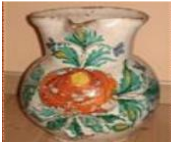
Slika 7. Bukaleta s biljnim motivima