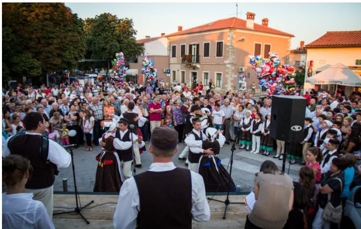
Slika 10. Predstavljanje domaćeg istarskog melosa na Bartulji