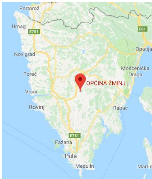
Slika 1. Prikaz položaja Općine Žminj na karti Istarske županije