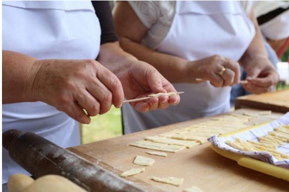
Slika 11. Tradicionalna priprema „istarskih fuži“