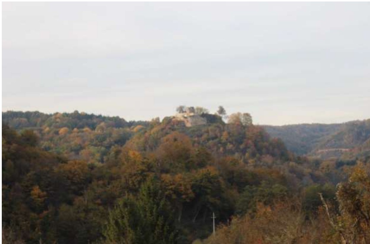
(Silvio Džafić, Ostaci Zrina)

sa Šibenikom i Trogirom. Ova velika koalicija odlučila se suprotstaviti navodno autokratskoj vladavini Mladena te su ga na vojnom polju porazili u bitci kod Bliske godine 1322. pod zapovjedništvom slavonskog bana Ivana Babonića. Nakon tog poraza dolazi do podjele i unutar moćnih Banića te jedan dio ostaje u Bribiru, a drugi dio pod vodstvom Mladenova brata Grgura s kraljem Ludovikom Velikim mijenja grad Ostrovicu za Zrin na Uni 1347. godine. Tim činom počinje se stvarati novi identitet knezova Bribirskih utemeljen na novom stolnom gradu Zrinu koji je tada bio u Slavoniji. Činom zamjene osnovana je nova loza i ogranak Šubića koji nosi titulu Zrinski ( de Zrino ). 2 Naime, Juraj III. Bribirski, sin Mladenova brata Pavla II. i Grgurov nećak i štićenik, postaje Juraj I. Zrinski.