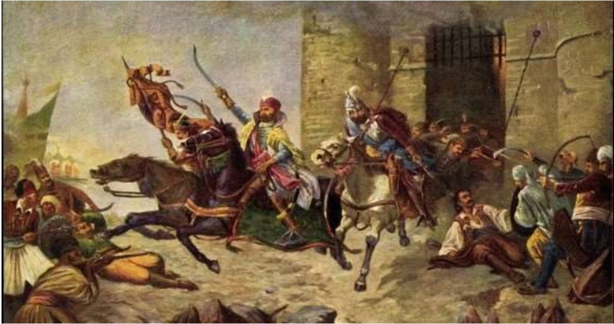
(Oton Iveković, Provala Nikole Zrinskog iz Sigeta , 1889.)

Sramotna je bila neodlučnost carsko-kršćanske vojske, koja nije napravila ništa da pomogne braniteljima u Sigetu. Priče o opsadi Sigeta su se proširile cijelom Europom pa i dalje, što je Nikolu IV. Zrinskog Sigetskog i njegove borce odvelo u besmrtnost. Nikolu je naslijedio njegov sin Juraj po kojemu se nastavila loza grofova Zrinskih iz Čakovca.