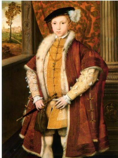
Slika 4. Eduard VI. Tudor (1537.-1553.) kralj Engleske i drugi kralj Irske

Eduard VI. Tudor (1537.-1553.) bio je kralj Engleske i drugi kralj Irske ( slika 4. ) naslijedivši svojeg oca Henrika VIII. Tudora. Eduard je rođen kao dugo očekivani sin kralja Henrika VIII. i treće kraljice, Jane Seymour, koja je umrla dvanaest dana po njegovu rođenju. Nekoliko dana nakon rođenja dobio je titulu princa od Walesa, koja ga je automatski označila kao Henrikovog nasljednika. Bio je prvi protestant na engleskom tronu te je tek za vrijeme njegove vladavine protestantizam postao službena i glavna religija svih Engleza, iako je već njegov otac razdvojio englesko katoličanstvo od rimokatoličanstva.