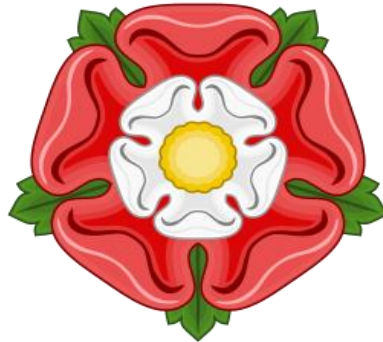
Slika 2. Simbol dinastije Tudor (crveno-bijela ruža)

dinastija Henrika VII. nosila je naziv Tudor, a objedinjavala je simbolički crvenu i bijelu ružu (slika 2.), simbole nekoć sukobljenih dinastija Lancaster i York.