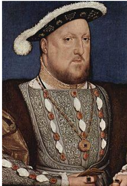
Slika 3. Henrik VIII. Tudor kralj Engleske i prvi kralj Irske

Henrik VIII. Tudor ( slika 3. ) se rodio 28. lipnja 1491. u palači Placentia kraj Greenwicha, kao treće dijete Henrika VII., engleskog kralja i kraljice Elizabete, koja je bila kći Edvarda IV. i nasljednica kuće York. U trenutku Henrikova rođenja, njegov je otac, pobijedivši u Ratu dviju ruža (Lancaster i York), koji je trajao od 1454. do 1485. te sklopivši brak s Elizabetom od Yorka, uspio učvrstiti prevlast Tudora na engleskom prijestolju. Budući da je Henrik rođen kao drugi sin, bilo je očekivano da prijestolje, nakon smrti Henrika VII., pripadne starijem sinu Arthuru. Stoga se Henrika pripremalo za život na drukčiji način nego što je to bio slučaj s Arthurom. U njegovo se obrazovanje mnogo ulagalo, a na dvoru se govorilo da je Henrikova sudbina crkva, a ne kraljevanje svjetovnim dobrima. Imao je najbolje privatne učitelje koji su ga podučavali latinskom, francuskom i španjolskom jeziku, a proučavao je i starogrčke tekstove jer se u ovom kasnom razdoblju vladavine Henrika VII. događao snažan prodor antičke literature na englesko tlo. 23