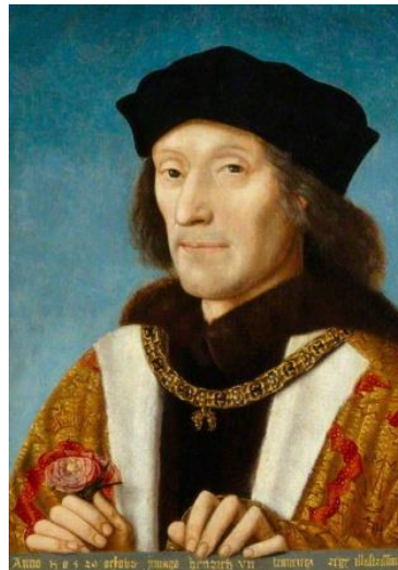
Slika 1. Prvi engleski vladar iz dinastije Tudor, kralj Henrik VII.

Kralj Henrik VII. ( slika 1. ) prvi engleski vladar iz dinastije Tudor, rođen je 28. siječnja 1457. Rodio se u velškom dvorcu Pembroke, snažno utvrđenoj srednjovjekovnoj rezidenciji smještenoj na krajnjem jugozapadnom dijelu Walesa. Pembroke je u srednjem vijeku služio kao središte grofovije Pembrokeshire. Budući da je Henrikov otac Edmund Tudor preminuo tri mjeseca prije njegovog rođenja, Henrik VII. rođen je kao posmrče te ga je odgojio stric Jasper Tudor.