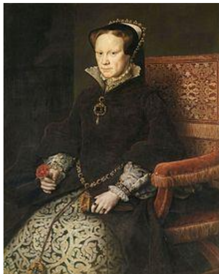
Slika 5. Marija I. Tudor (1516.-1558.) engleska kraljica

Marija I. Tudor (1516.-1558.) engleska je kraljica i pretposljednja vladarica iz dinastije Tudor ( slika 5. ), najpoznatija po svojem pokušaju vraćanja i obnavljanja katoličanstva u Engleskoj. Bila je kći engleskog kralja Henrika VIII. i njegove prve žene Katarine Aragonske te, po majci, unuka španjolskog kralja Ferdinanda II. i kraljice Izabele. Bila je vrlo napredno, ali boležljivo dijete lošeg vida i problema sa sinusima, zbog kojih je imala jake glavobolje. S devet godina je postala službena nasljednica svojeg oca Henrika VIII., premda je on silno želio imati muškog nasljednika. Za njezin odgoj brinula se majka Katarina koja ju je sama podučavala latinski jezik, a uz pomoć španjolskih učitelja učila je i grčki jezik, znanosti i glazbu.