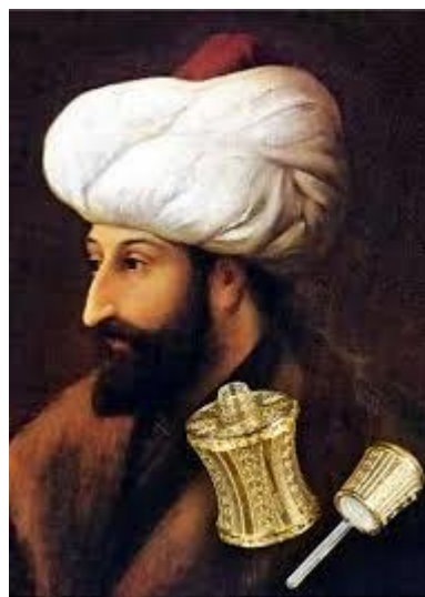
Sultan Mehmet Osvajač