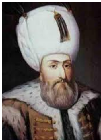
Sultan Sulejman Veličanstveni