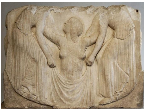
Slika 2: skulptura iz doba Rimske kulture

Veliki broj homoseksualnih bliskosti i ljubavnih priča daje naslutiti kako je spolna bliskost i emocionalno vezivanje među muškarcima iste socijalne skupine bila poznata u drevnim civilizacijama