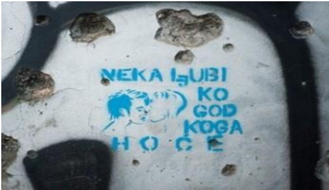
Slika 4: Prikaz slobode biranja