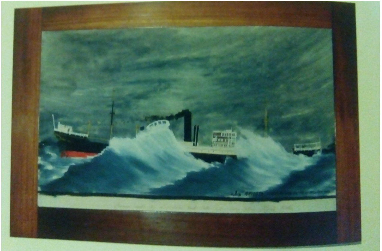
Prilog 3. Slika parobroda Aristo spomen Antona Filipaša 1930. pri prolazu Biskajskim zaljevom. Slika je iz crkve sv. Jurja u Brseču 29