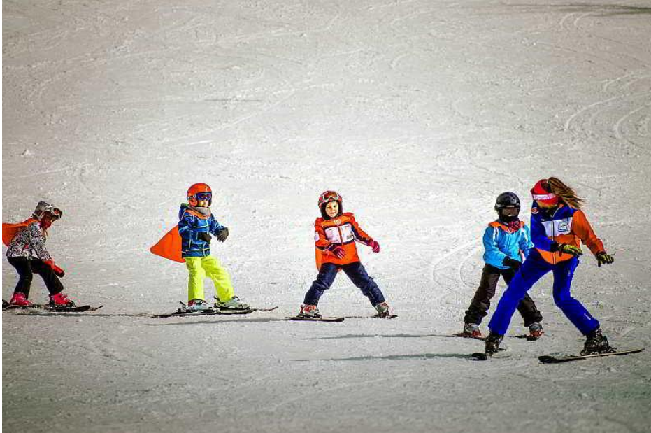
Slika 5. Sat sportskog tjelesnog vježbanja