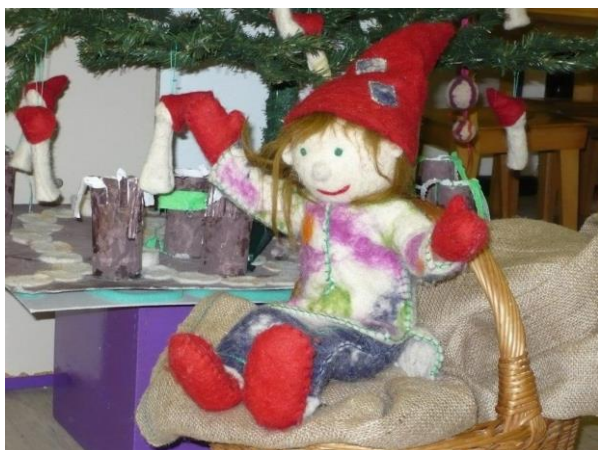
Slika 8. Macmalić – rođendanski gost