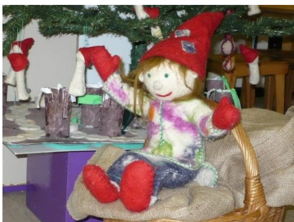
Slika 8. Macmalić – rođendanski gost