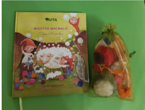
Slika 11. Slikovnica „Majstor Macmalić“