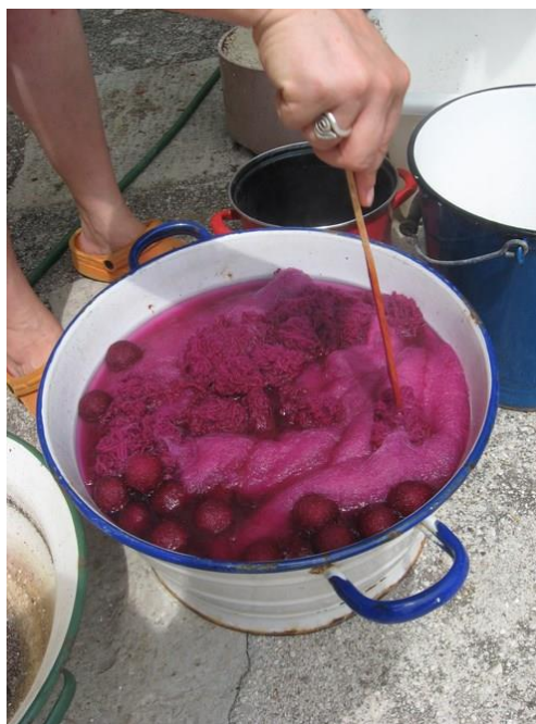
Slika 5. Proces bojanja vune