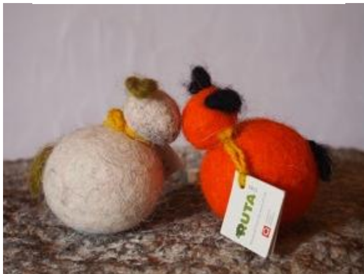
Slika 3. Ručni rad udruge RUTA - ovčice