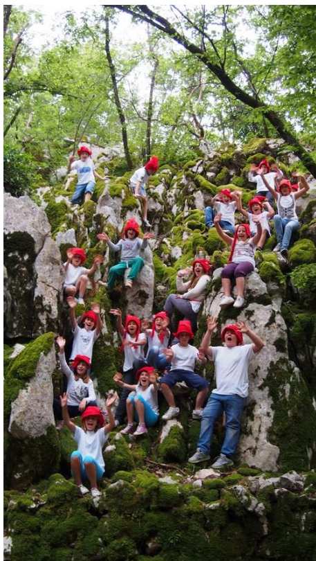
Slika 6. Posjet šumi Tramuntane