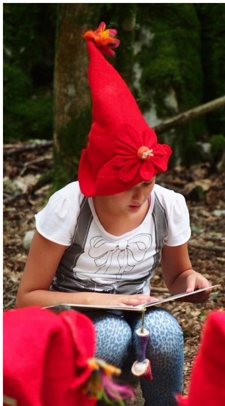
Slika 7. Djevojčica čita slikovnicu „Tajna Masmalića“

Izvor: Ruta Cres, http://ruta-cres.hr/aktivnosti-2/projekti/tajna-masmalica/ . Pristupljeno: 1. rujna 2018.