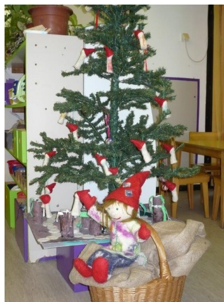
Slika 9. Bor ukrašen Macmalićima