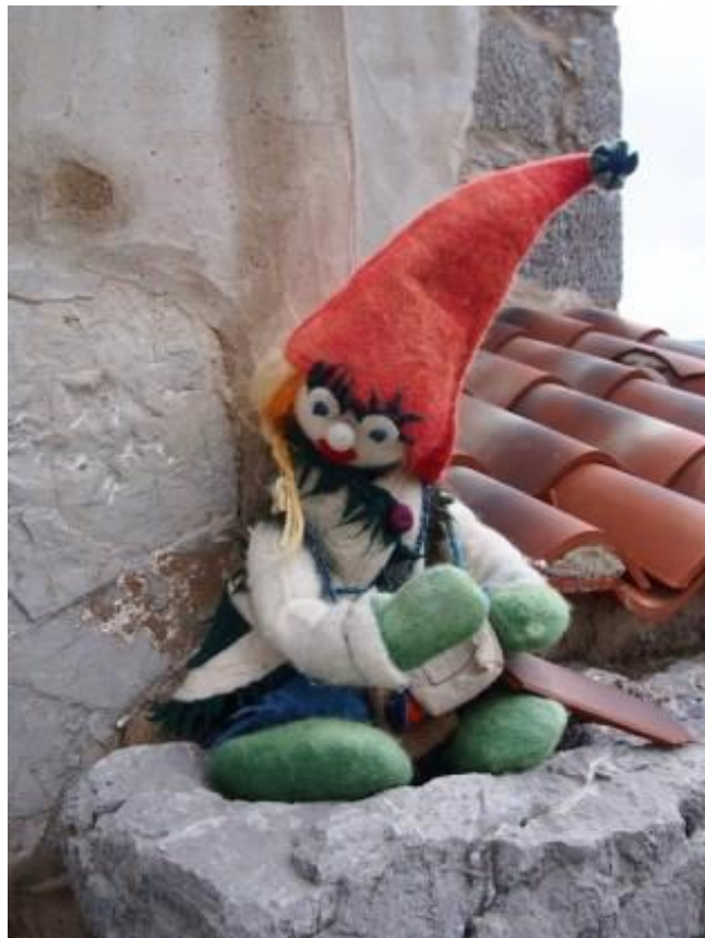
Slika 2. Lutka Masmalića