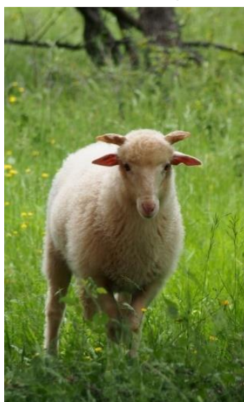
Slika 1. Creska ovca pramenka

Izvor: Ruta Cres, http://ruta-cres.hr/vuna-i-filcanje-2/ . Pristupljeno: 1. rujna 2018.