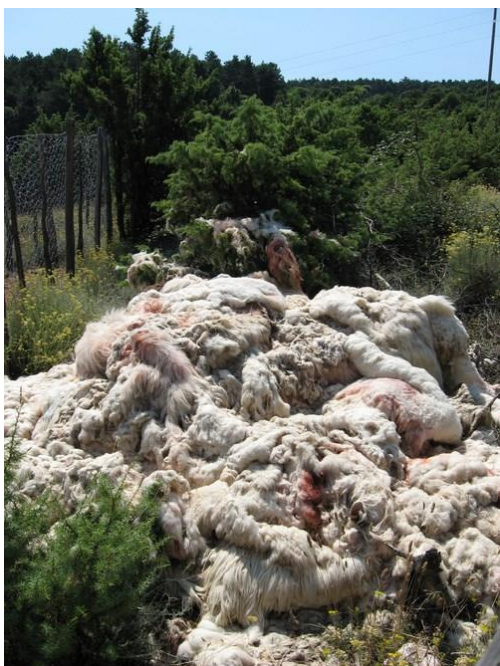
Slika 4. Ostavljena vuna u prirodi