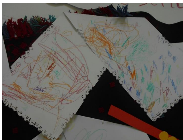
Slika br. 21 – Djetetov uradak peškira pomoću olovaka u boji i bušilice za papir