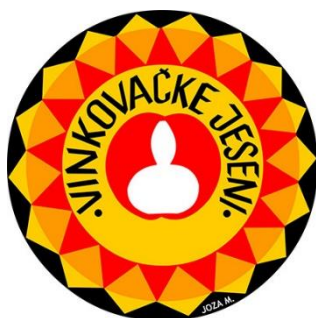
Slika 2. Grb Vinkovačkih jeseni

„To je smotra koja teži trajnoj afirmaciji izvornoga kulturno - umjetničkoga narodnoga stvaralaštva temeljenog na bogatoj baštini naroda vinkovačkoga kraja i cijele Hrvatske.“ (Službena stranica Vinkovačkih jeseni , 2018.).