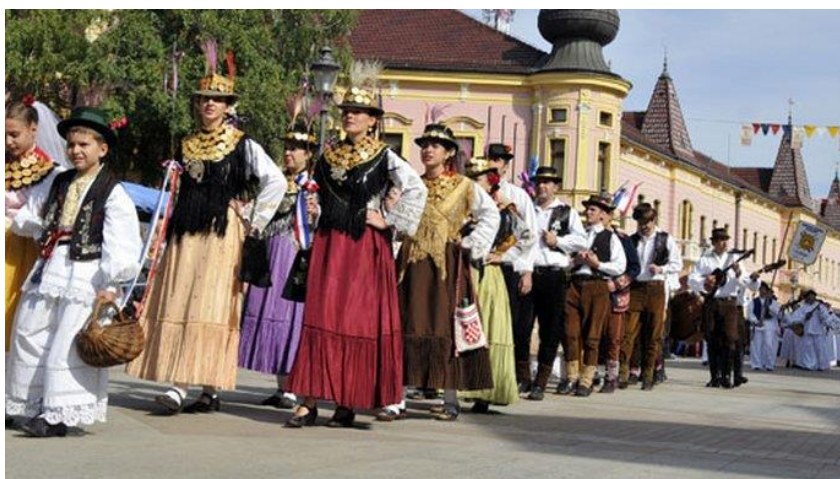
Slika 3. Svečani mimohod