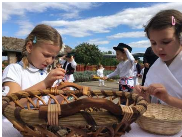
Slika br. 10 – Djevojčice se igraju kao njihove prabake, izrađuju nakit