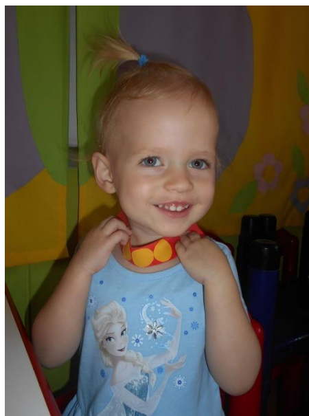
Slika br. 23 – Izrađena ogrlica s dukatima