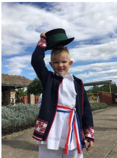
Slika br. 11 – Djeca na modnoj reviji dječjih narodnih nošnji