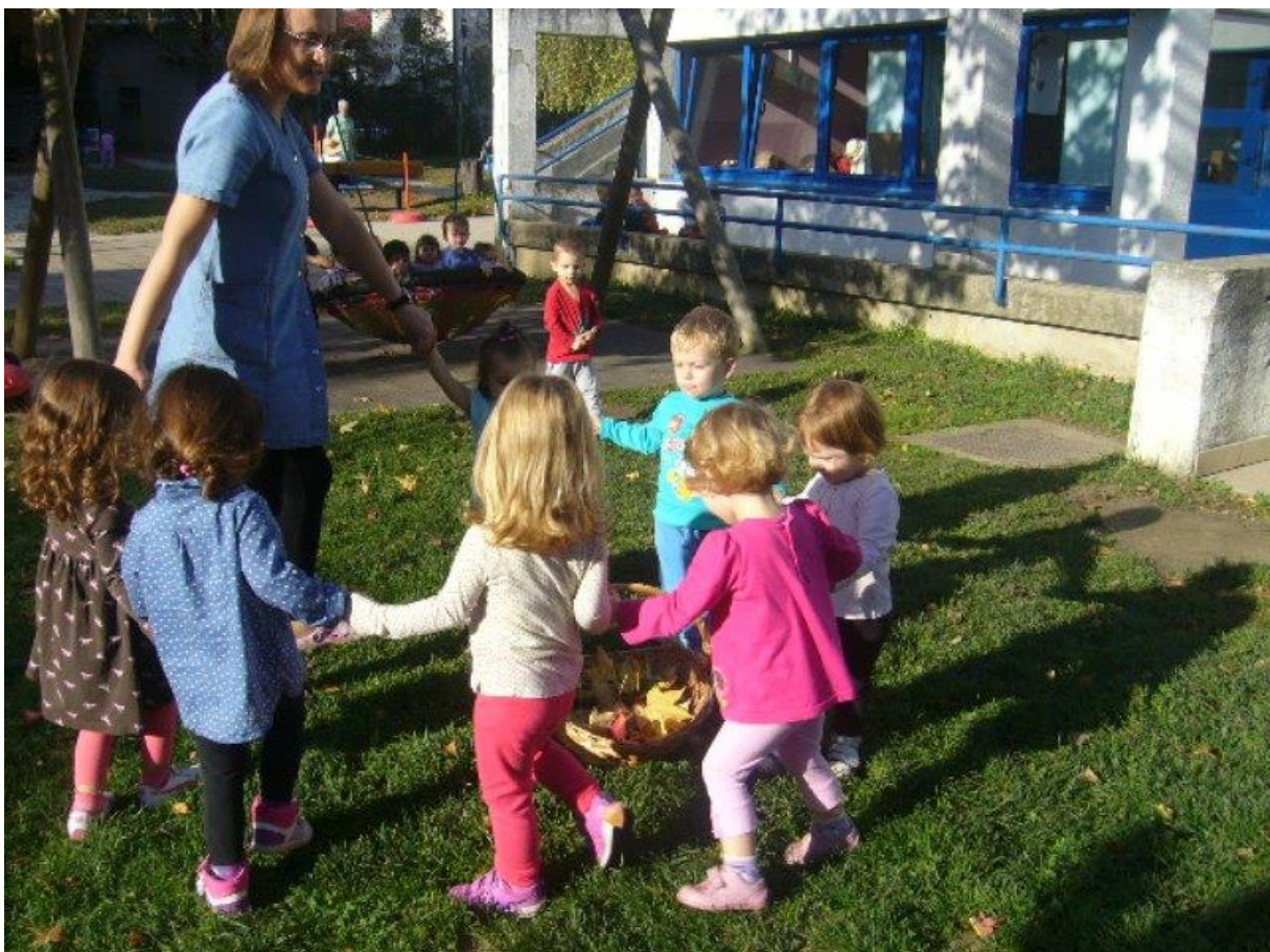
Slika 3. Igra „Ringe, ringe raja“

Prema Findaku i Deliji (2001) igra je u predškolskoj dobi osnovna aktivnost djeteta te utječe na razvoj antropoloških obilježja, usvajanje motoričkih znanja, poboljšanje motoričkih dostignuća, stjecanje životnih i radnih navika.