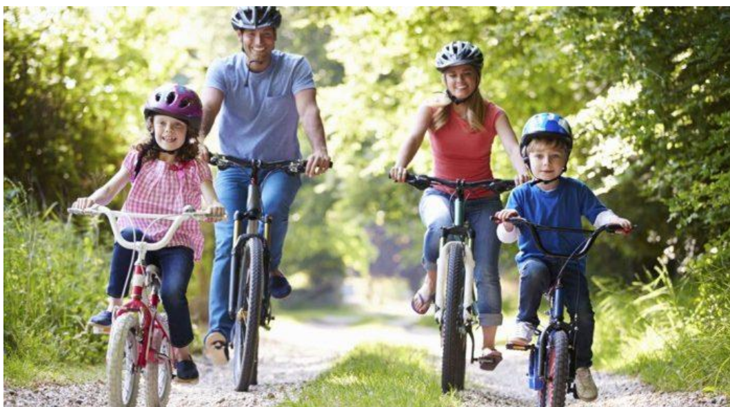
Slika 18. Obiteljska vožnja biciklima u prirodi

Boterill i Patrick (2000) govore kako posredno življenje kroz dijete može ponekad imati vrlo poražavajuće rezultate na samu osobnost djeteta. To se najviše projicira kroz uključenost roditelja u sportski život djeteta preko mjere, onda kada roditelj pokušava kroz život djeteta nadoknaditi pogreške ili vlastita odustajanja u mladosti. Takvo posredno življenje kroz dijete može postati veliki teret za mladog sportaša i uzrok akutnog osjećaja osramoćenosti. Previše roditelja fokusira se na sam rezultat sporta pa zlatne medalje postaju centar sportskog života njihovog djeteta. Autori također naglašavaju kako je u redu biti ambiciozan, ali studije pokazuju da manje od jedan posto djece uključene u sportske aktivnosti će na kraju i zarađivati i živjeti na temelju tog sporta. Najveći savjet koji autori nude je da roditelj bude prepun podrške, ali da ostane racionalan ako se ispostavi da dijete nije u rangu vrhunskog sportaša kako ne bi došlo do narušavanja socijalnih odnosa u obitelji. Roditelji ponekad zaborave koje su iskonske vrijednosti za njih i njihovo dijete i koje vrijednosti treba njegovati neovisno o rezultatima koje dijete postiže. Pravilan rast i razvoj djeteta te pripremanje za daljnji život trebaju biti glavni fokus svake obitelji sportaša. Znajući tko smo, što je važno u životu i kako sport utječe na naš život, važne su pretpostavke od kojih roditelji moraju krenuti tijekom razgovora sa svojim djetetom o sportu.