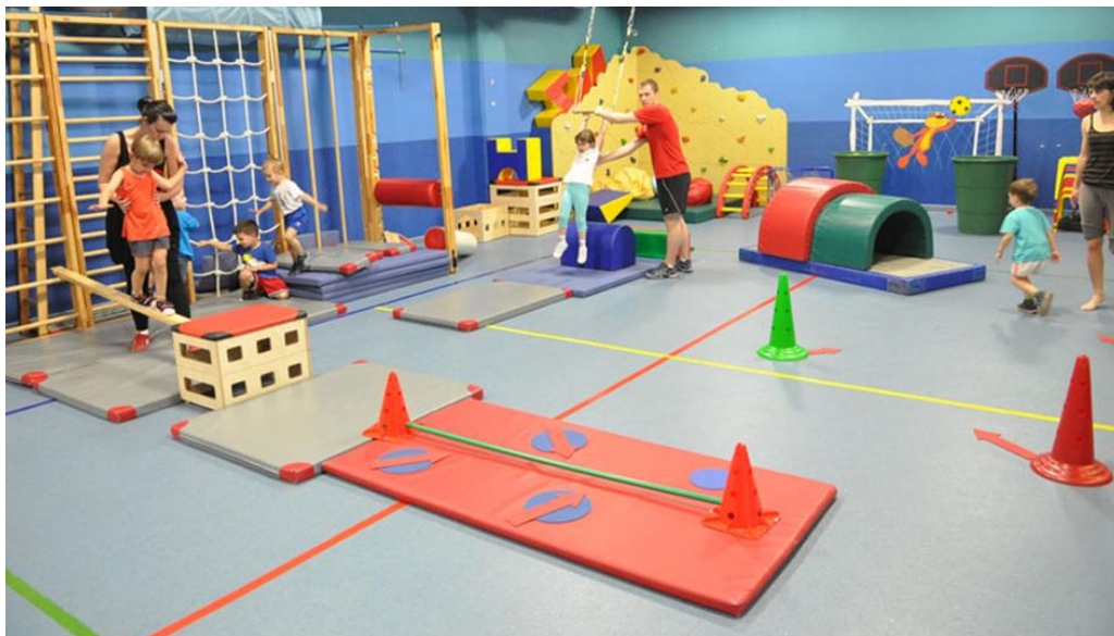
Slika 7. Sadržaji jedne sportske igraonice

Sindik (2008) spominje opasnosti tijekom prvog susreta sa sportom kod djece, a kojih roditelji, odgajatelji i sportski treneri moraju biti svjesni tijekom rada s djecom. Spominje natjecanje kao dilemu i koje je evolucijski prirodno djetetu, ali isto tako u prevelikim količinama može vrlo negativno utjecati na emocionalni i socijalni status djeteta. Djecu nije poželjno uključivati u složene i polistrukturalne kineziološke aktivnosti (po elementima koje treba savladati složene, ili pak timske sportove, gdje je nužna suradnja većeg broja pojedinaca, s različitim ulogama), jer je vjerojatnije da će u takvim aktivnostima djeca doživjeti neuspjeh, ako prethodno nisu adekvatno educirana. Odgovarajuća edukacija djece svodi se najčešće na sustavno „pojednostavljenje“ motoričkih i informatičkih komponenti kineziološke aktivnosti, koju provodi educirani stručnjak u primjerenom programu namijenjenom predškolskoj djeci, kao što je npr. slučaj u sportskim igraonicama.