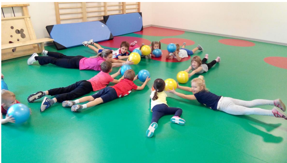
Slika 15. Vježbe s loptom