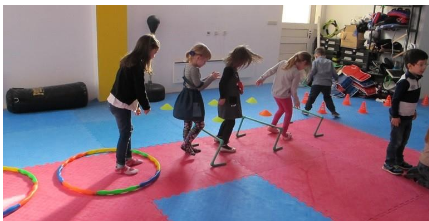
Slika 16. Vježbe ravnoteže i koordinacije

Kako djetetovo tijelo sazrijeva, evolucija motoričkih vještina ovisi o sve više efikasnim načinima procesuiranja informacija. Ukratko, kako bi motorički razvoj napredovao, kognitivni razvoj mora napredovati sukladno s njim pa tako dijete iz jednostavnijih motoričkih zadataka uči i usavršava stvari potrebne za izvršavanje kompleksnijih akcija. Četiri osnovna motorička kapaciteta koji reflektiraju djetetovu atletsku vještinu su prethodno navedene ravnoteža, fleksibilnost, brzina i snaga. Usavršavanje svakog od ta četiri kapaciteta zahtjeva određenu mentalnu snagu i napor.