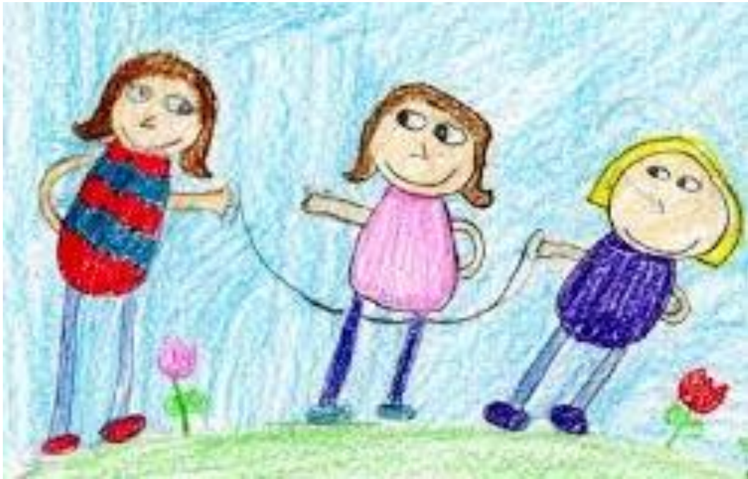
Slika 6. Preskakanje vijače

da je djetetovo tijelo većim volumenom pokriveno kožom stoga je bitno da je što čišća i u neposrednom dodiru zraka.