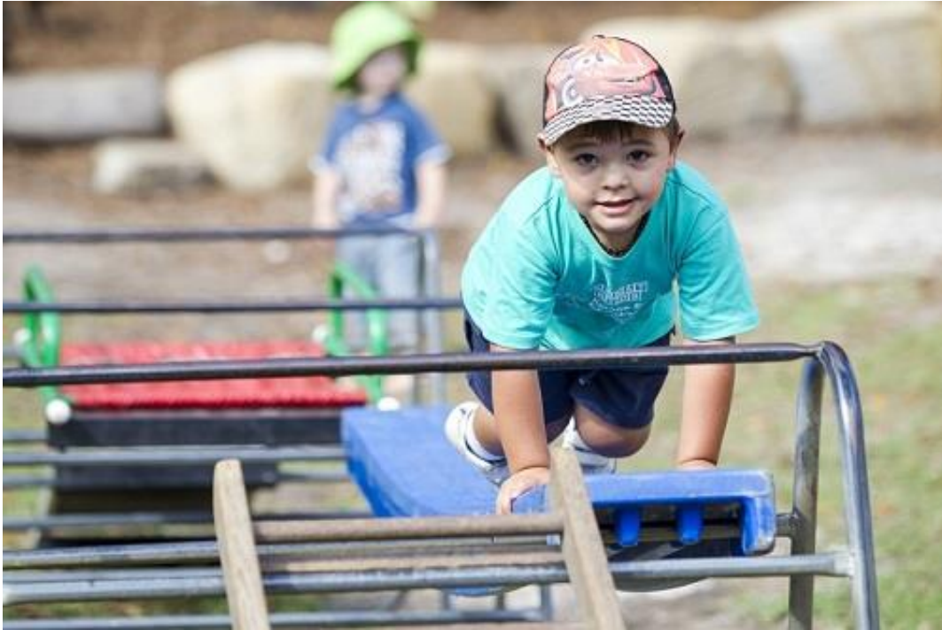
Slika 5. Igra s preprekama