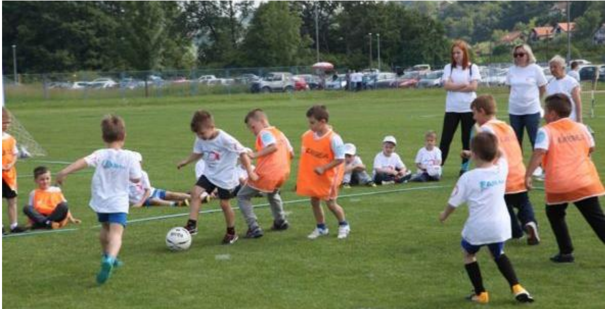
Slika 10. Nogometna igra