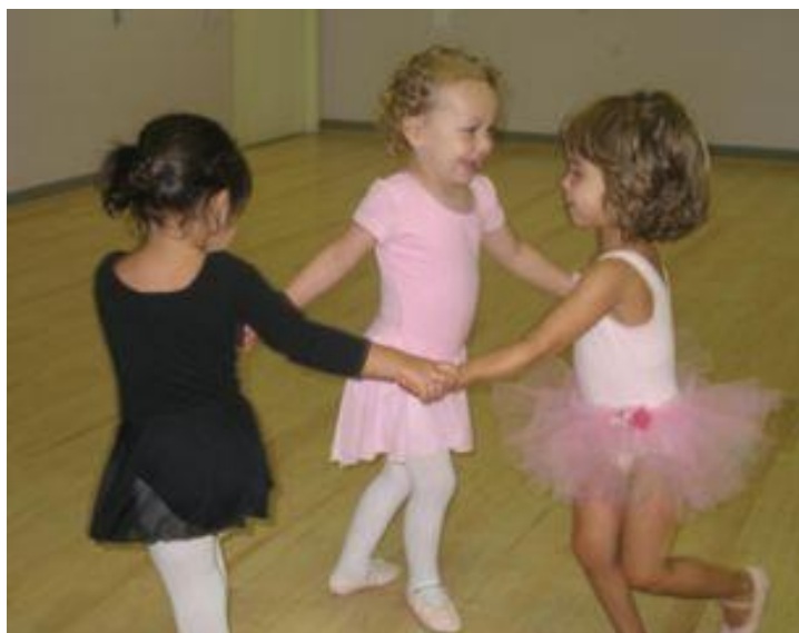
Slika 2. Ples djece

Pica (2008) naglašava kako je najvažnija stvar koju jedan odgajatelj može učiniti za dijete je dati mu dovoljno vremena, prostora i prilika za kretanje. Također, po njegovom mišljenju, važno je pažljivo promatrati dijete. Često je vjerovanje kako djeca automatski razvijaju motorička znanja i dovode ih do savršenstva. Ta znanja uključuju trčanje, skakanje i bacanje. To je prirodni proces koji se odražava kroz fizičko i kognitivno sazrijevanje, ali taj proces se odnosi na svladavanje znanja koja su primarna tj. znanja koje je dijete sposobno izvesti na početničkoj razini. Dojenče se samo okreće i radozno gleda oko sebe, u jednom trenutku počne puzati i nedugo nakon toga diže se na noge i pridržava rukama za predmete u okolini. Oko djetetovog prvog rođendana javljaju se i prvi koraci, te nakon toga trčanje. Sazrijevanje pridonosi samo jednom aspektu razvoja motoričkih znanja, te već u dobi od jedne godine dijete može izražavati simptome nesavladanih znanja krupne motorike poput hodanja ili trčanja. To uključuje djecu koja još nisu savladala pokrete oprečnosti desne ruke i lijeve noge, lijeve ruke i desne noge, djecu čiji najmanji prstići na stopalima se odižu od zemlje dok hodaju i djecu čija stopala zadiru prema unutra tijekom hodanja. Kompetentno dijete će se rado nastaviti kretati i uključivati se u plesanje, preskakanje užeta ili ljuljati se i visjeti s opreme koja je dio dječjeg igrališta.