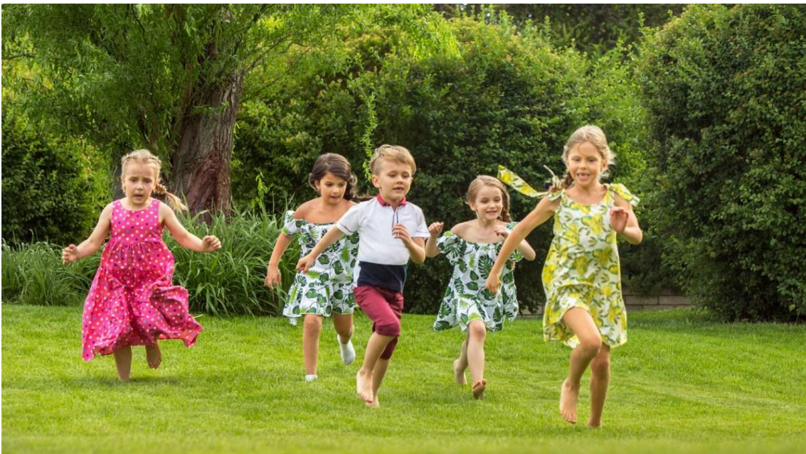
Slika 12. Trčanje po neravnom terenu

Sindik (2008) govori da se tjelesnom aktivnošću pokreće prilagodbena sposobnost lokomotornog sustava; otpornost vezivnog tkiva, tetiva i ligamenata, hrskavice i kostiju te izdržljivost velikih mišićnih skupina. Sport pozitivno djeluje na imunološki sustav i krvožilni sustav, a zamjetni su i poželjni metabolički, endokrinološki i hemodinamički efekti.