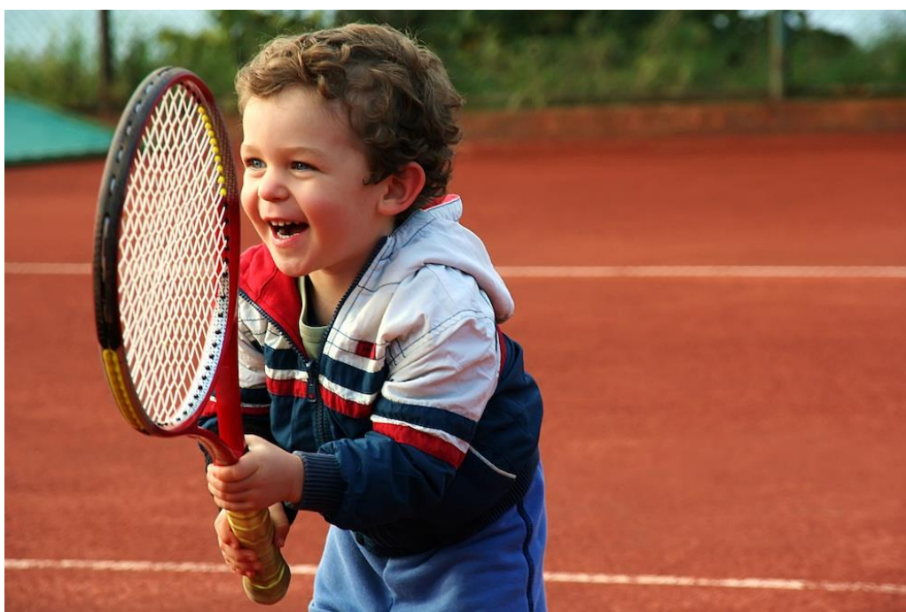
Slika 4. Individualni sport u ranoj dobi

Djeca predškolske dobi posebno su osjetljiva na vanjske podražaje okoline i njezin motivacijski ili demotivacijski učinak na djetetovo unutarnje stanje. Prema Sindik (2008) preuranjeno i silovito ulaženje u svijet sporta za dijete može biti traumatizirajuće iskustvo i vrlo brzo prouzročiti negativni efekt pa tako dijete s kojim se neprimjereno postupa ili se od njega očekuje previše za njegovu dob može vršiti veliki otpor prema fizičkoj aktivnosti tijekom cijelog života nakon takvog iskustva. Kako bi se dijete pravilno poticalo u ostvarenju njegovih tjelesnih, socijalnih i mentalnih potreba i želja važno je unaprijed znati pojedine elemente koji sačinjavaju cjelokupnu sliku djeteta. Bez poznavanja psihofizičkih osobina djeteta, ne možemo procijeniti koji sport i u kojoj mjeri je primjeren kojem djetetu a isto tako ne možemo očekivati vrhunske rezultate od djeteta koje razvojno još nije primjereno tim zadacima.