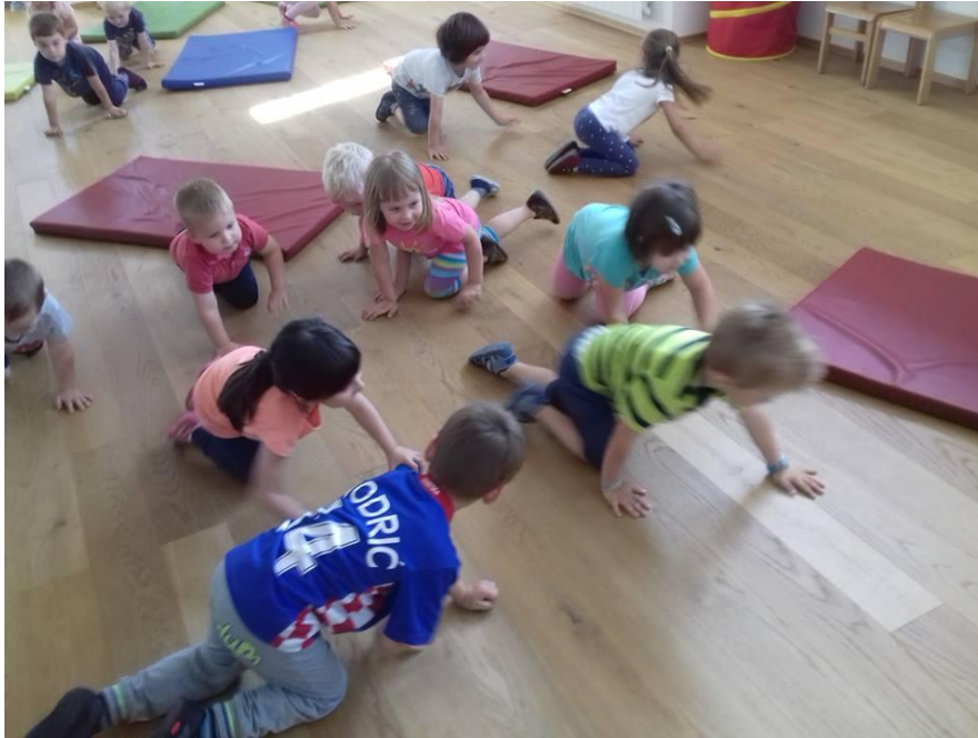
Slika 13. Provedba sata tjelesnog vježbanja s djecom vrtićke dobi

Sport omogućuje djeci da se kreću onoliko koliko žele, jačaju se njihovi mišići i kosti, ali i unutarnji organi. Kad dijete potrči ubrzava se njegov puls, ono počinje dublje i češće disati jer mišići pri trčanju obavljaju naporniji rad, pa srce, pluća i drugi sustavi organizma prirodno povećavaju svoju produktivnost i snagu.