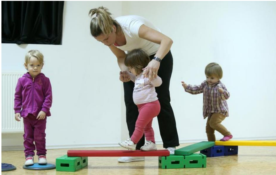
Slika 11. Početne vježbe hodanja po gredi

je u zraku na pod. Dinamička ravnoteža definirana je zadacima u kojima se u tijeku kretanja savladavaju sile što remete održavanje ravnotežnog položaja, a najbolje se opisuje uz vježbu hodanja po gredi.