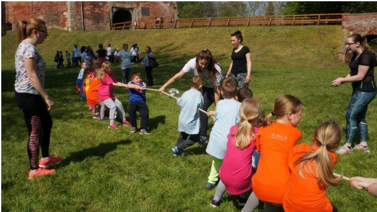
Slika 9. Dječja igra potezanja konopa

Lorger i Prskalo (2010) govore da bi motoričke igre djece predškolske dobi trebale svojim sadržajem poticati razvoj osnovnih motoričkih sposobnosti djeteta, a njihov cilj bi trebao biti usmjerenje na poticanje brzine, koordinacije, skočnosti, fleksibilnosti i jakosti djece. Sadržaje tih motoričkih igara trebalo bi „vezati“ uz elemente različitih sportskih igara (nogomet, rukomet, košarka...) koje su popularne kod djece i primjerene njihovoj dobi. Struktura takvih gibanja treba biti primjerena predškolskoj dobi djece kako bi se naglasila njihova uloga u razvoju motorike ruku i nogu, odnosno koordinacije u pokretu s različitim pomagalima tijekom igre. Sami sadržaji motoričkih igara trebaju biti različiti i potencirati različita motorička iskustva djece. Atmosfera u svim igrama treba biti motivirajuća, živa i ugodna djeci kako bi ih uz motoričke igre „vezala“ ugodna i poticajna sjećanja. Zadovoljstvo i uživanje djeteta su prioriteti svake motoričke igre, a slijeđenje pravila i pravilno ovladavanje tehnikom dolaze tek kao sekundarna važnost.