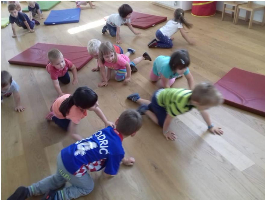
Slika 13. Provedba sata tjelesnog vježbanja s djecom vrtićke dobi

Sport omogućuje djeci da se kreću onoliko koliko žele, jačaju se njihovi mišići i kosti, ali i unutarnji organi. Kad dijete potrči ubrzava se njegov puls, ono počinje dublje i češće disati jer mišići pri trčanju obavljaju naporniji rad, pa srce, pluća i drugi sustavi organizma prirodno povećavaju svoju produktivnost i snagu.