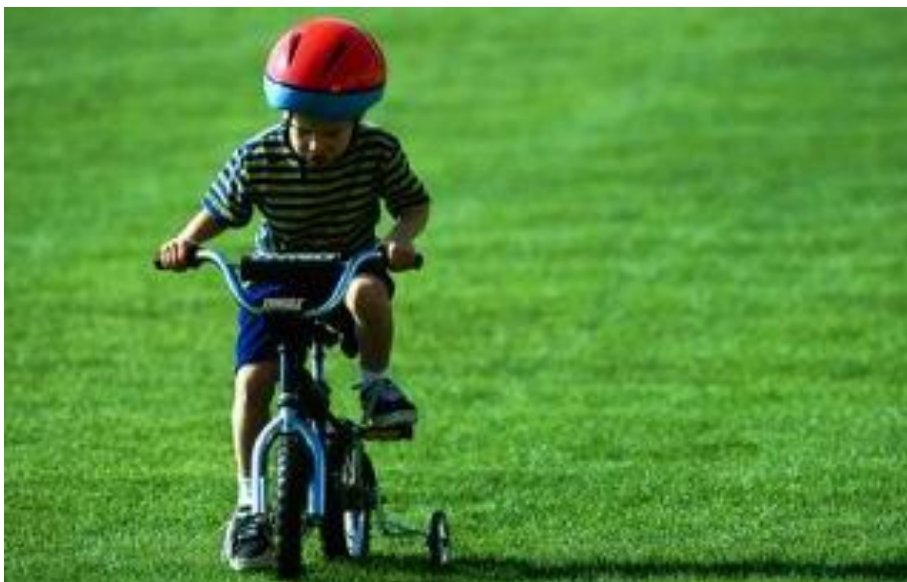
Slika 8. Vožnja bicikle

Prema Sindiku (2008) tijekom djetetova razvoja sport s pravilima u mlađoj dobi komplicirana je i zahtjevna stvar za dijete koje u toku svog normalnog razvoja još nema određene motoričke, kognitivne ili emocionalne vještine. Čak i odrasli ljudi vrlo često imaju problema sa svladavanjem temeljnih pravila određenoj sporta te s raščlanjivanjem pojedinih dijelova koje trebaju uvježbati u svrhu daljnjeg napredovanja. Djetetu mlađe predškolske dobi, ali i onom starijem, prije odabira svakog sporta treba ponuditi različite tjelesne aktivnosti koje više naginju slobodnoj igri nego igri s pravilima kojih se dijete treba pridržavati, a takve tjelesne aktivnosti mogu biti plesne igre, vožnja bicikla, pješaćenje na različitim terenima, ravnici, uzbrdici i nizbrdici te plivanje u bazenu, otvorenom ili zatvorenom.