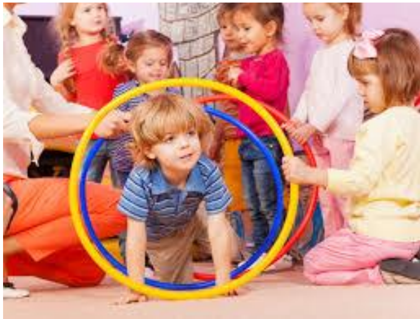
Slika 1. Provlačenje kroz obruč

djeteta sa sportom i svim faktorima koje on donosi sa sobom, uključujući razvijanje motoričkih i kognitivnih sposobnosti te emocionalnih i socijalnih osobina. Upoznavanje djeteta sa sportom treba biti u skladu s djetetovim razvojem, pa u skladu s time osoba zadužena za to, mora imati prethodna znanja i vještine te odabrane načine kako će djetetu pristupiti i kako će sport predstaviti prvenstveno kao izvor zabave i užitka. Krajnji cilj sporta svakako treba biti poboljšanje motoričkih i funkcionalnih sposobnosti djeteta, ali i emocionalnih i socijalnih osobina budući da one čine važnu sastavnicu u životu svakog pojedinca.