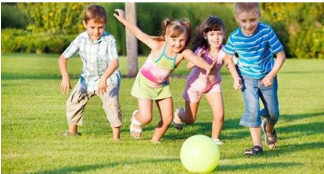
Slika 14. Igra s loptom na otvorenom