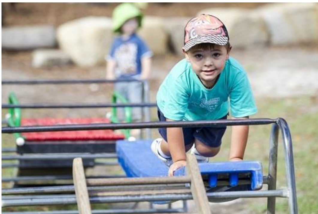
Slika 5. Igra s preprekama