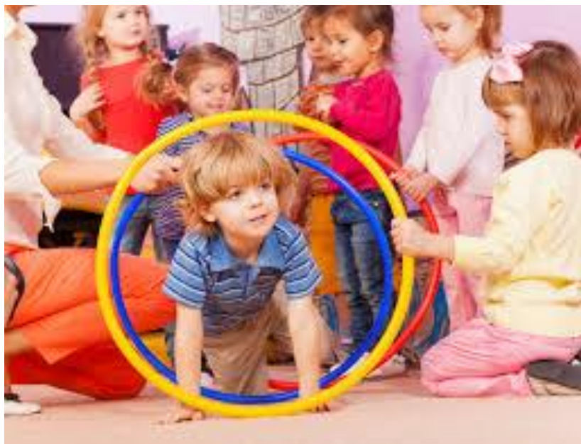
Slika 1. Provlačenje kroz обруč

djeteta sa sportom i svim faktorima koje on donosi sa sobom, uključujući razvijanje motoričkih i kognitivnih sposobnosti te emocionalnih i socijalnih osobina. Upoznavanje djeteta sa sportom treba biti u skladu s djetetovim razvojem, pa u skladu s time osoba zadužena za to, mora imati prethodna znanja i vještine te odabrane načine kako će djetetu pristupiti i kako će sport predstaviti prvenstveno kao izvor zabave i užitka. Krajnji cilj sporta svakako treba biti poboljšanje motoričkih i funkcionalnih sposobnosti djeteta, ali i emocionalnih i socijalnih osobina budući da one čine važnu sastavnicu u životu svakog pojedinca.