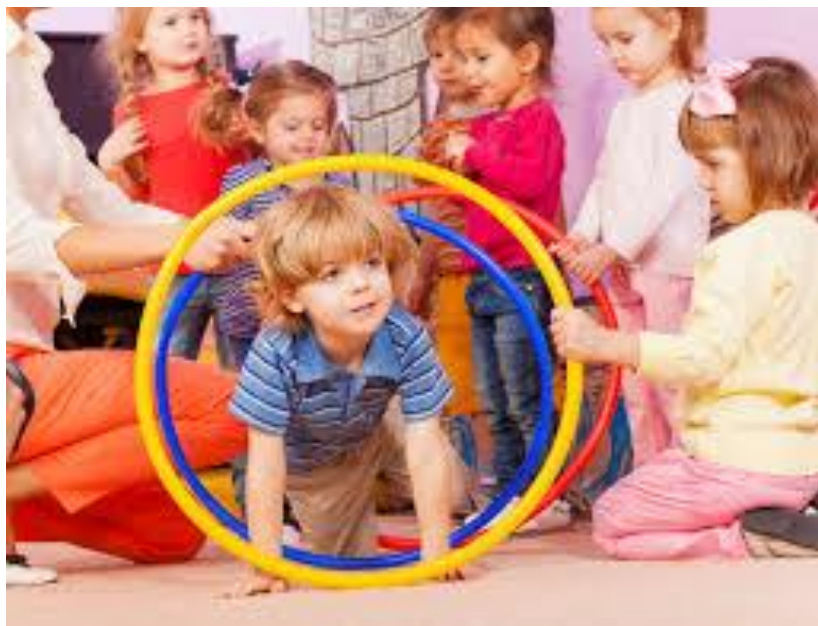
Slika 1. Provlačenje kroz obruč

djeteta sa sportom i svim faktorima koje on donosi sa sobom, uključujući razvijanje motoričkih i kognitivnih sposobnosti te emocionalnih i socijalnih osobina. Upoznavanje djeteta sa sportom treba biti u skladu s djetetovim razvojem, pa u skladu s time osoba zadužena za to, mora imati prethodna znanja i vještine te odabrane načine kako će djetetu pristupiti i kako će sport predstaviti prvenstveno kao izvor zabave i užitka. Krajnji cilj sporta svakako treba biti poboljšanje motoričkih i funkcionalnih sposobnosti djeteta, ali i emocionalnih i socijalnih osobina budući da one čine važnu sastavnicu u životu svakog pojedinca.