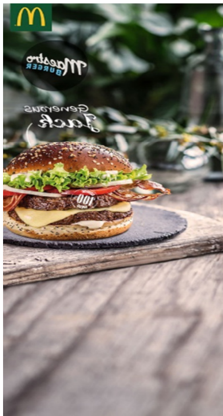
Slika 9. Oglas za McDonalds (lijevi wallpaper)