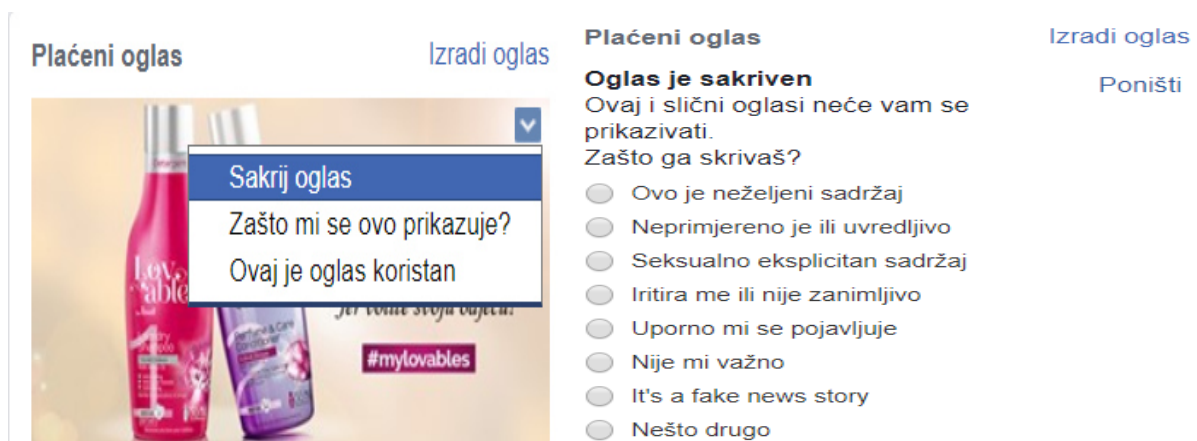
Slika 1. Primjer oglasa na Facebook-u

Oglašavanje na društvenim mrežama je jedno od novijih vrsta oglašavanja. Društvene mreže koriste milijuni korisnika u svijetu što je velika prednost za oglašivače jer na jednom mjestu dolaze do velikog broja potencijalnih potrošača uz relativno niske troškove i brzu povratnu informaciju. Neke od popularnih društvenih mreža su Facebook, Twitter, Instagram i LinkedIn. Korisnici društvenih mreža su uglavnom ljudi srednje i mlađe dobne skupine. Iako danas postoji veliki broj i djece školske dobi na društvenim mrežama. Preko društvenih mreža se mogu skupiti razne informacije o osobama. Što te osobe vole, čime se bave u poslovno i privatno vrijeme, kakvu vrstu glazbe slušaju, koje proizvode koriste, koju marku ili tip proizvoda, a to su sve informacije koje olakšavaju oglašivačima kako bi postavili oglase tamo gdje će najprije dobiti povratnu informaciju.