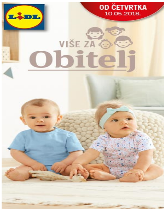
Slika 11. Oglas za Lidl (pola strane)