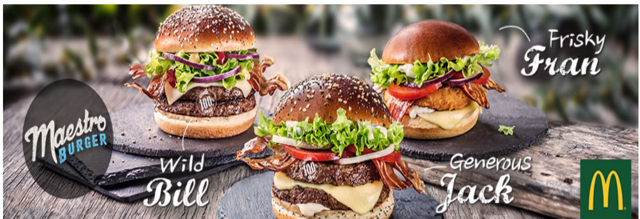
Slika 8. Oglas za McDonalds (billboard)