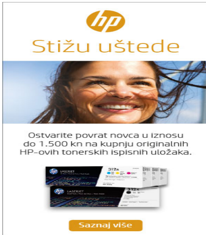
Slika 5. Oglas za HP (statični banner)