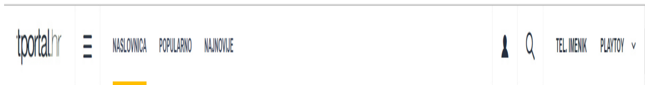
Slika 4. Alatna traka T-portala