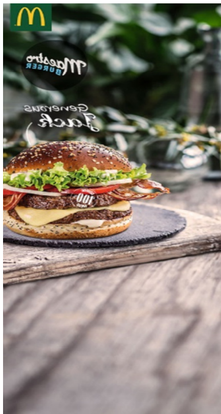
Slika 9. Oglas za McDonalds (lijevi wallpaper)