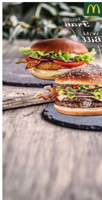
Slika 10. Oglas za McDonalds (desni wallpaper)