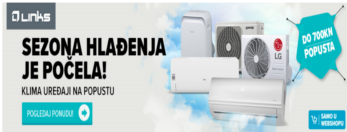
Slika 7. Oglas za Links (horizontalni banner)