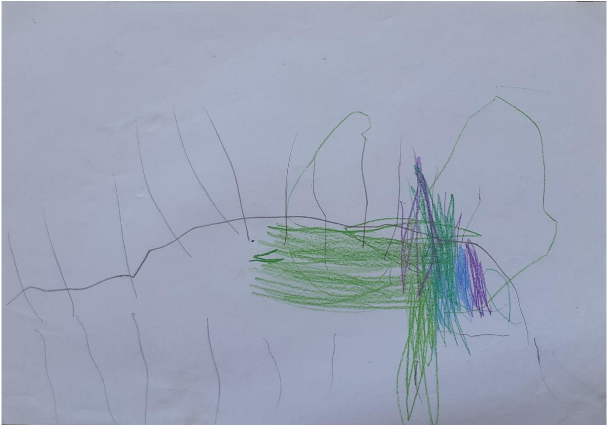
Slika 12: Krokodil, dječak M. P., 4 godine