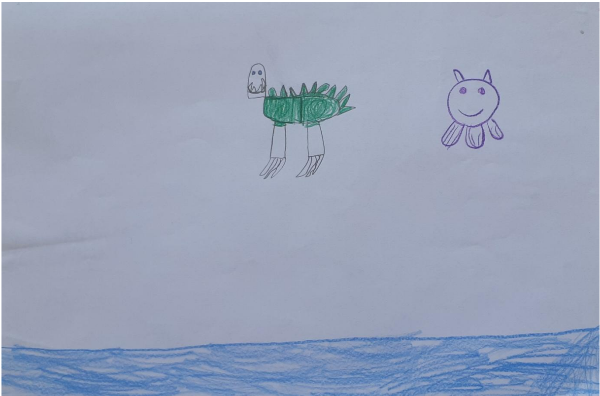
Slika 2: Krokodil, djevojčica A. Š., 5 i pol godina