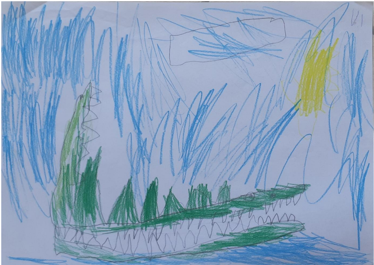
Slika 7: Krokodil, dječak V. Đ., 5 godina