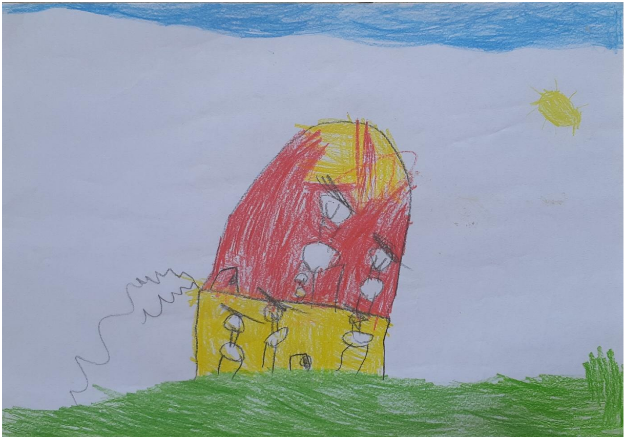
Slika 9: Škola za životinje, dječak I. L., 4 godine