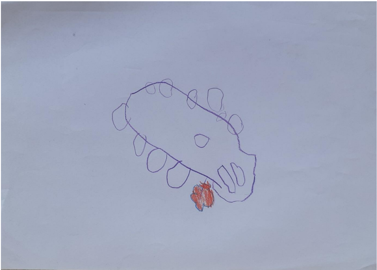
Slika 13: Krokodil, djevojčica J. Š. , 3 godine