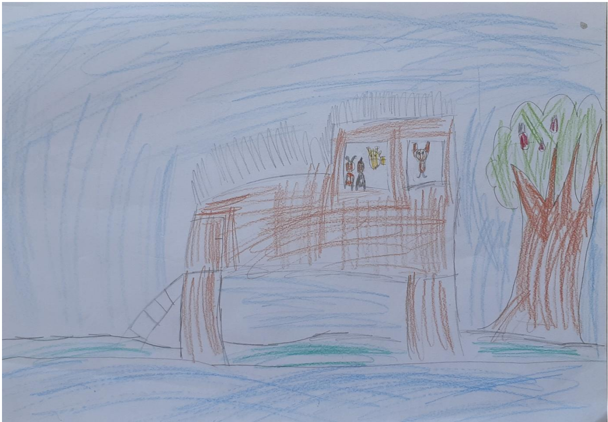
Slika 5: Škola za životinje L. M., djevojčica 6 godina