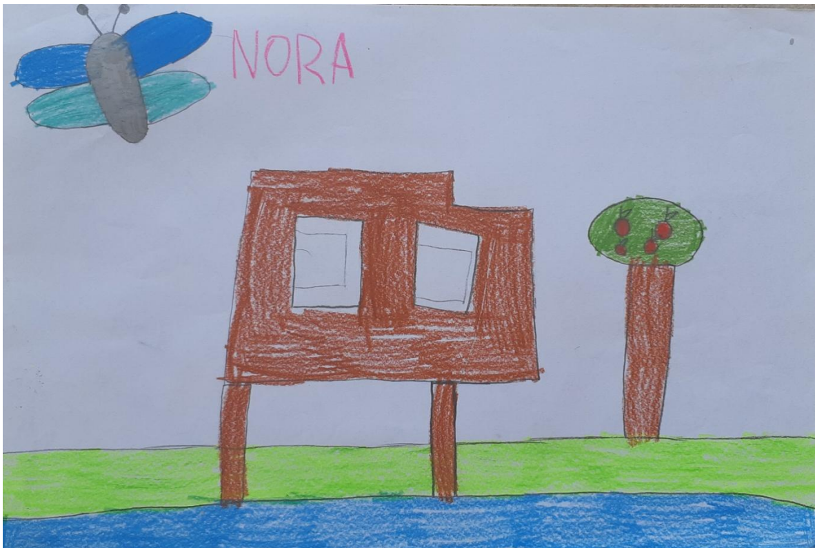
Slika 3: Škola za životinje, djevojčica N. L., 6 godina