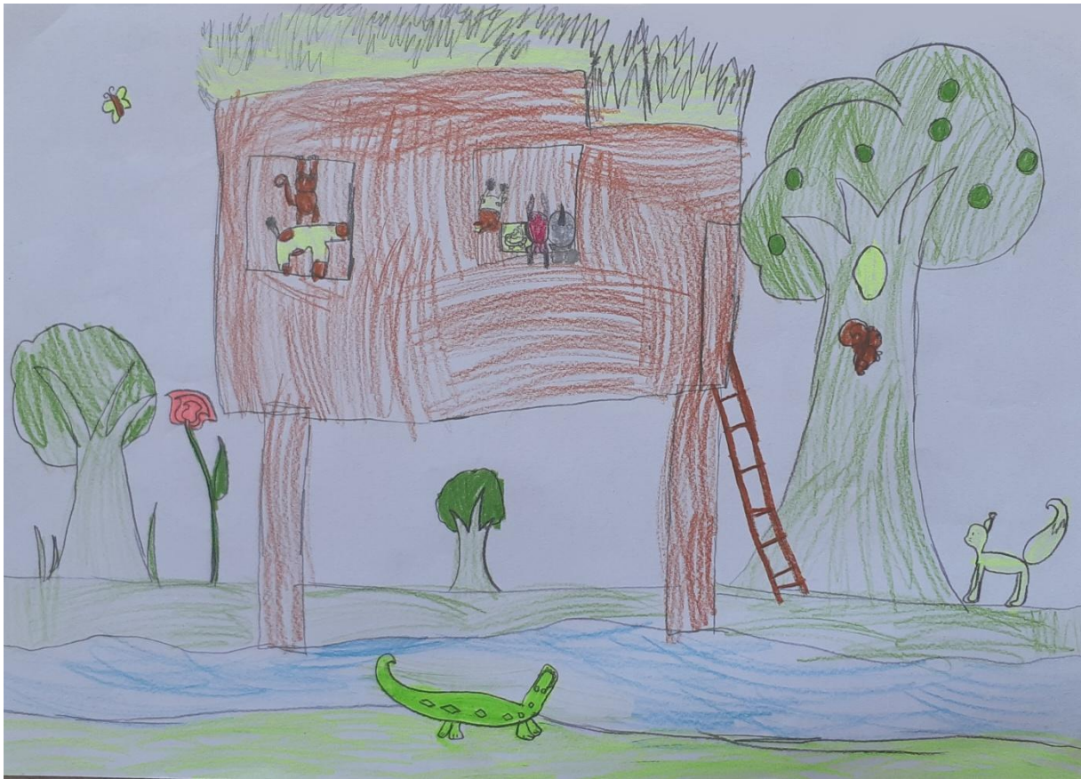
Slika 10: Škola za životinje, dječak A. G., 5 godina

PITANJE: Možeš mi molim te nabrojati što si nam ti sve nacrtao?