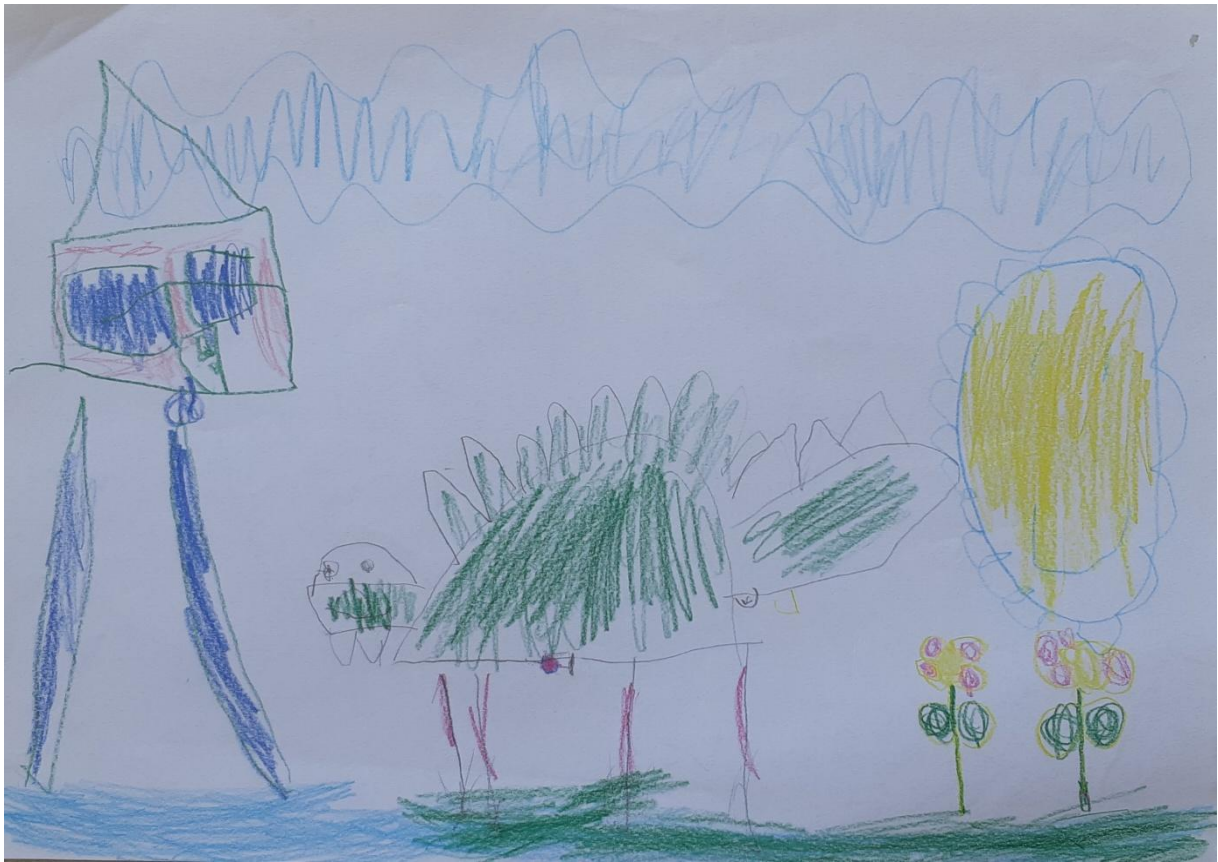
Slika 8: Krokodil, dječak L. D., 6 i pol godina

PITANJE: Što je najveće što se nalazi na tvom crtežu? Kojom bojom je to prikazano?