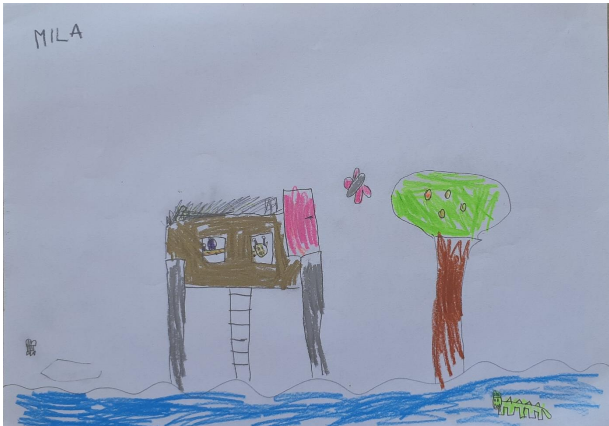
Slika 4: Škola za životinje, djevojčica M. M., 6 godina