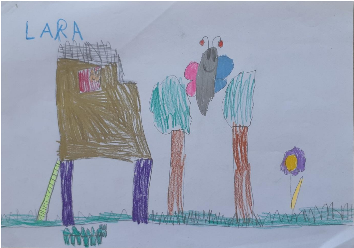
Slika 6: Škola za životinje, djevojčica L. M., 6 godina