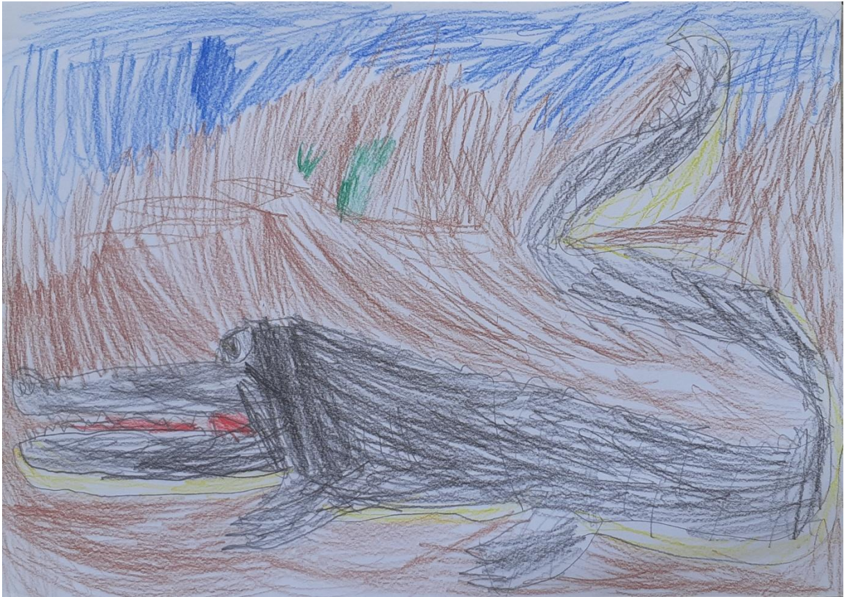
Slika 11: Krokodil-kajman, dječak D. V., 5 godina