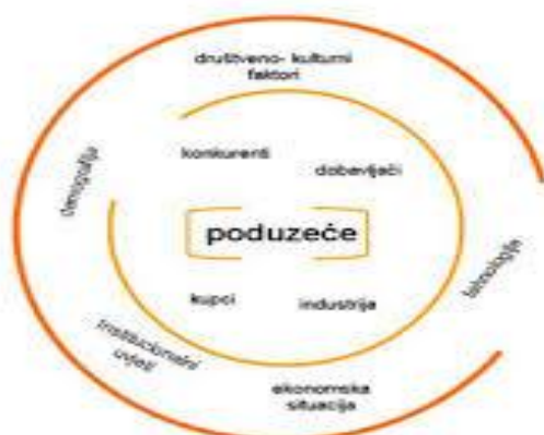
Slika 1 Okruženje poduzeća

Vanjska okolina može podijeliti na gospodarsko i socijalno okruženje. 1