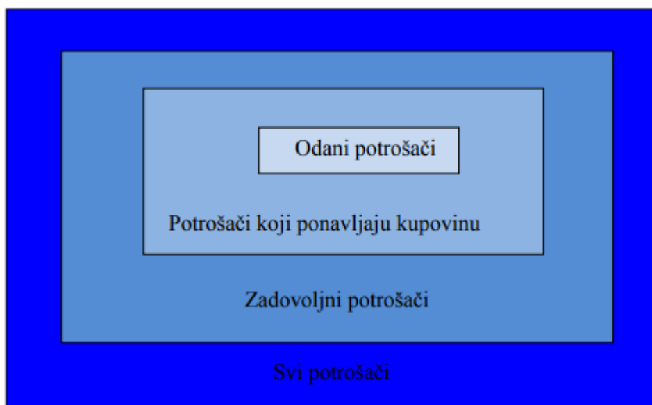
Figure 4. Stvaranje odanih potrošača

Prema Vraneševiću, moguće je razlikovati kupce prema razini zadovoljstva i lojalnosti kao: