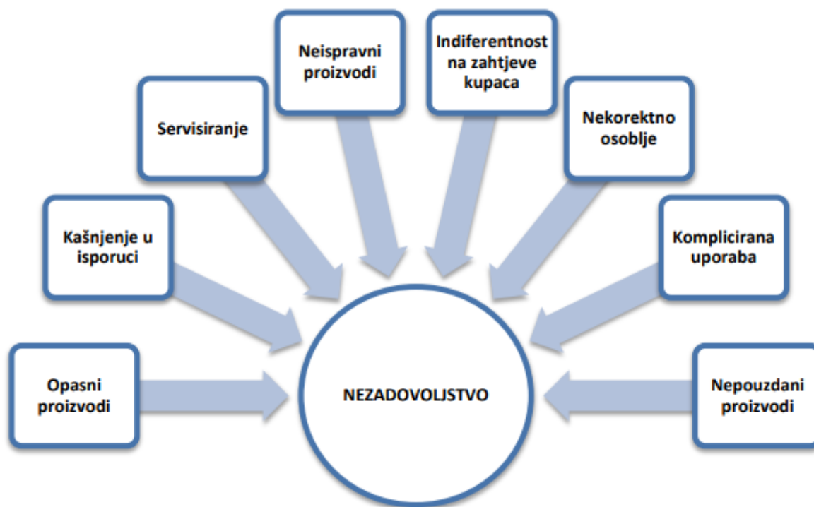
Figure 1. Faktori koji izazivaju nezadovoljstvo kupaca

Utjecaji na nezadovoljstvo mogu biti neefektivni procesi ili neželjene karakteristike proizvoda. U slučaju njihove pojave značajno opada zadovoljstvo kupaca, no u slučaju da se oni ne pojave zadovoljstvo kupaca ne raste, već ostaje na istoj razini. Strategija očuvanja lojalnosti kupaca koju mnoge tvrtke koriste je držanje faktora koji utječu na zadovoljstvo pod kontrolom. 14 U nastavku će se hijerarhijskim prikazom prikazati mogući načini odgovora na nezadovoljstvo kupaca.