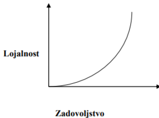
Figure 3. Odnos lojalnosti i zadovoljstva kupaca

Prethodni prikaz pokazuje odnos lojalnosti i zadovoljstva kupaca, te je vidljivo da je odnos lojalnosti kupaca progresivno proporcionalan sa zadovoljstvom istih. Kupci koji su oduševljeni proizvodima i/ili uslugama tvrtke označavaju stvarnu lojalnost i puno su veća vrijednost za tvrtku od primjerice nezadovoljnih kupaca. 17