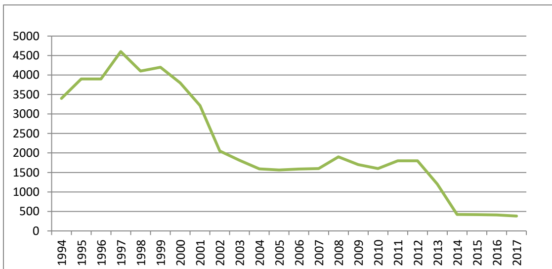
Grafikon 1. Ukupni prihod od carina u konsolidirani proračunu opće države.