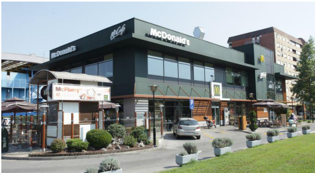
Slika 7. McDonald's restoran

Izvor: Lider media (2018.) McDonald's planira uvesti dostavu u Hrvatskoj. Dostupno na: https://lider.media/aktualno/tvrtke-i-trzista/poslovna-scena/mcdonalds-planira-uvesti-dostavu-u-hrvatskoj/ (06.08.2018.).