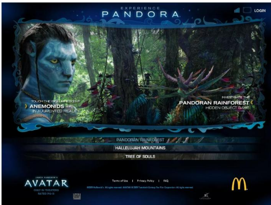
Slika 5. Primjer virtualne stvarnosti u McDonald'su