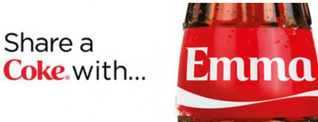
Slika 9. Personalizirana boca Coca-Cole