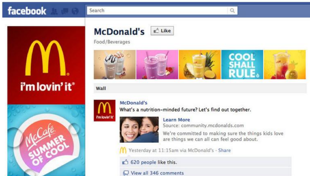
Slika 6. Facebook profil McDonald'sa

McDonald's Facebook page on July 27.