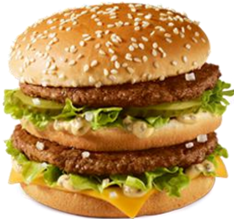
Slika 3. Big Mack i Happy Meal

Osnovna obilježja njihove poslovne filozofije očituju se u kontinuiranim, cjelovitim i kvalitetnim istraživanjima tržišta. To se daje ujedno potvrditi i heterogenošću proizvoda koji su namijenjeni različitim skupinama potrošača. Svakako tome treba pridodati i kontinuitet u razvoju novih proizvoda, kao i zadržavanje onih primarnih na kojima se zasniva identitet kompanije. Među njima su svakako Big Mack i Happy Meal, koji se nalaze u ponudi od osnivanja kompanije pa sve do danas, bez ikakvih izmjena i izuzeća. Ujedno je riječ o najpopularnijim proizvodima (Slika 3.).