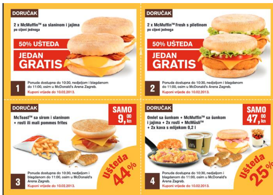
Slika 4. McDonald's kuponi