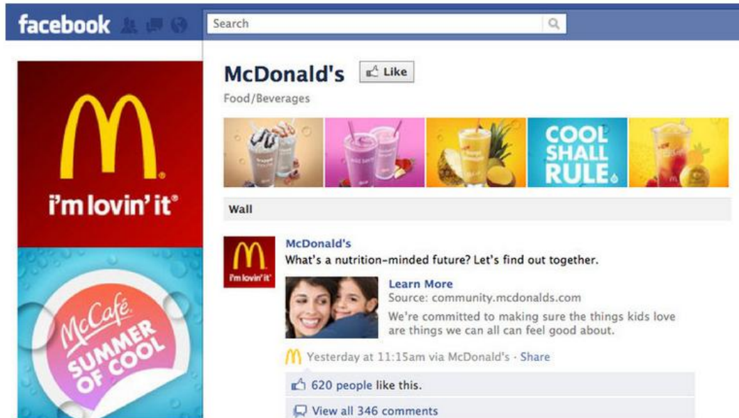
Slika 6. Facebook profil McDonald'sa

McDonald's Facebook page on July 27.