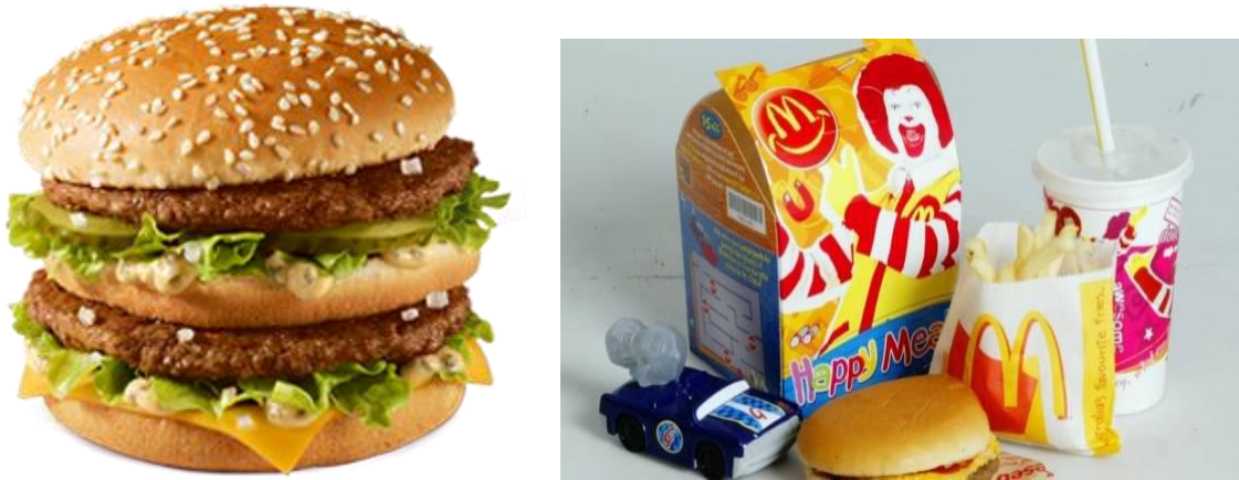
Slika 3. Big Mack i Happy Meal