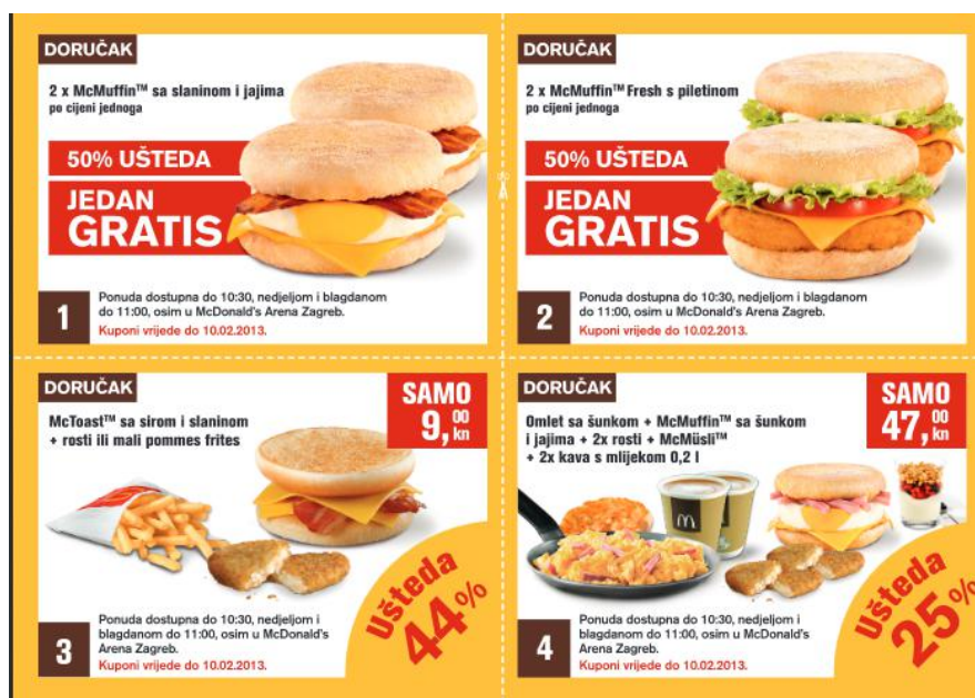
Slika 4. McDonald's kuponi